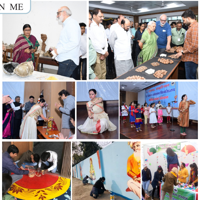
Lalit Kala Sansthan, Activity