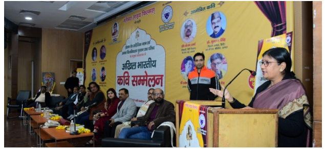
ITHM Kavi Sammelan