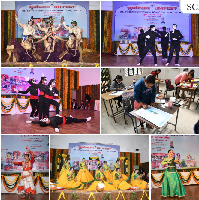
'UNIFEST' 1-3 December, 2022