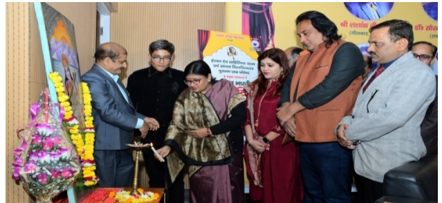
International conference ITHM