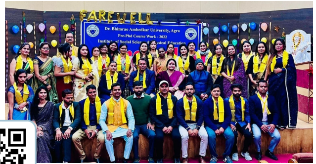
Ph.D. Group 24.12.2022