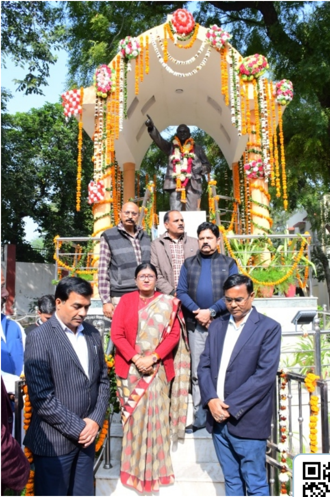
Dr. Bhimrao Ambedkar Program 06.12.2022