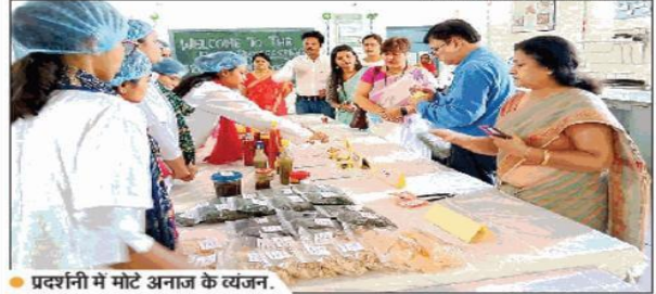
प्रदर्शनी में मोटे अनाज के व्यंजन.