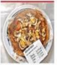
ज्वार से तैयार किया गया पिज्जा