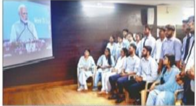
संवीक्षण विश्व क्षय रोग दिवस पर डॉ. भीमराव अंबेडकर विश्वविद्यालय के सेठ पद्मचंद्र जैन संस्थान में लगी स्क्रीन पर पीएम नरेंद्र मोदी का संबोधन सुनते छात्र-छात्राएं।