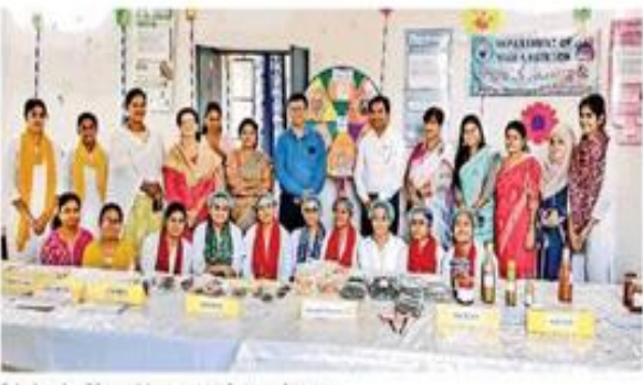
मिलेट फेयर में प्रदर्शित उत्पादों के साथ छात्रों व शिक्षकों

लोगों को फास्ट फूड से होने वाली बीमारियों से दूर रखने के लिए व प्राकृतिक अन्न की तरफ रुझान कराने के लिए यह प्रदर्शनी आयोजित की गई है.