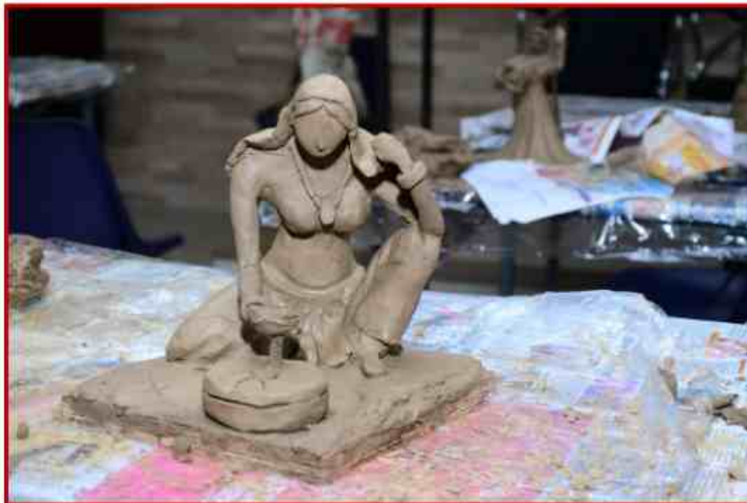
Clay Modeling in Youth Festival at Life Science