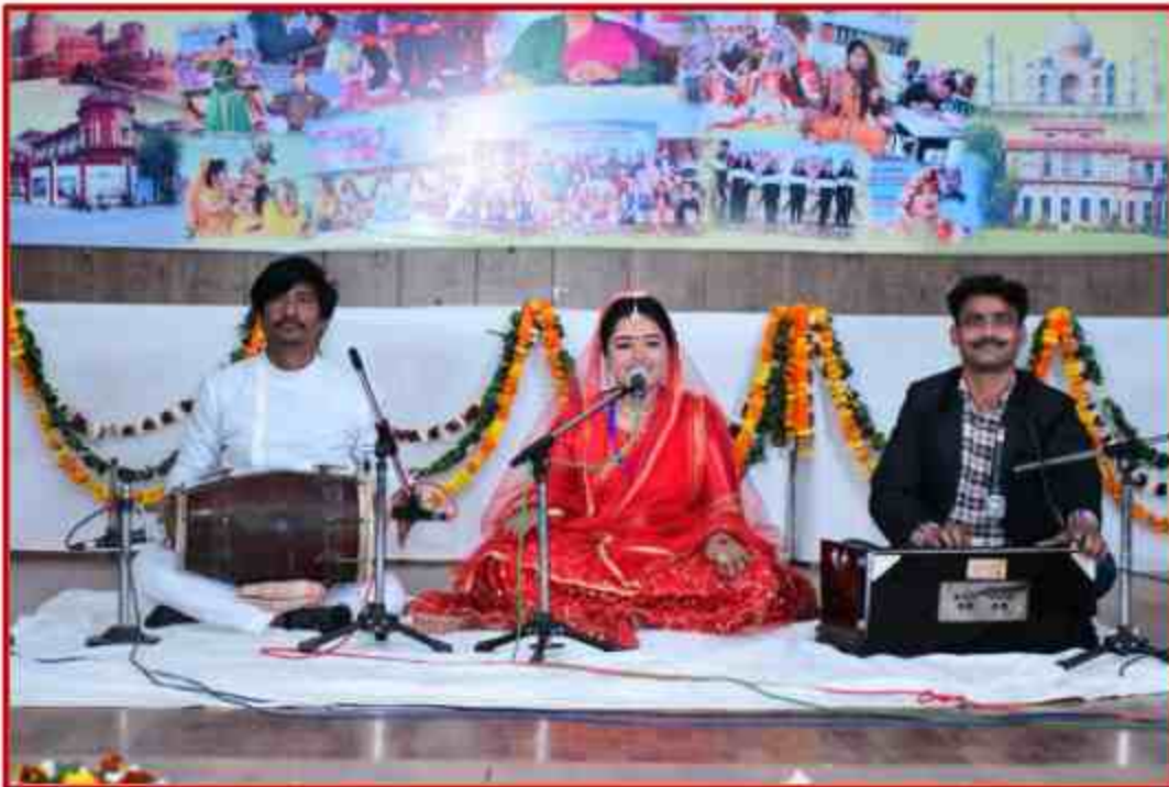
Student participant in Dancing competition in Youth Fest 2022 at J.P.Sabhagar