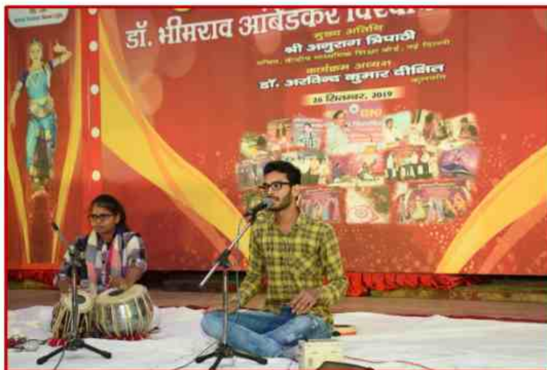
Student participant singing competition in Yuvotsav Samahroh 2019