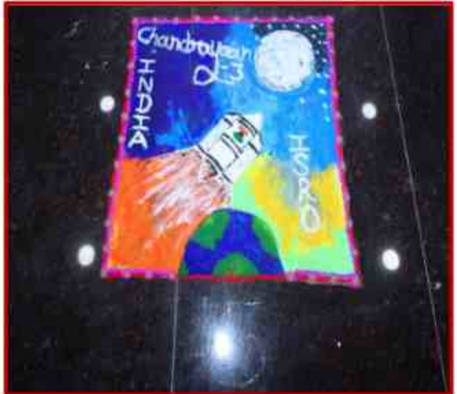
Student participating in Rangoli competition during Youth Fest at