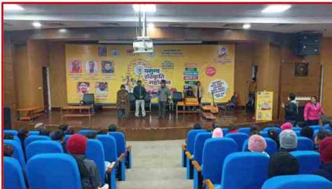
Yamuna Sanskriti Mahotsav at Sanskriti Bhawan