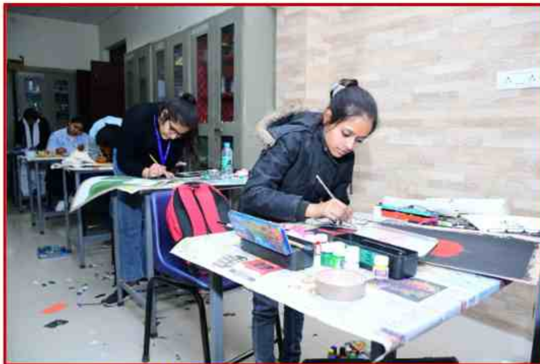
Poster Making in Youth Festival at Life Science