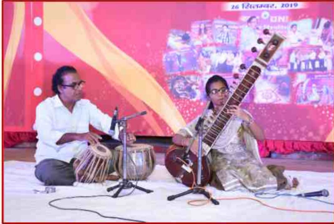
Student participant Swar vadya competition in Yuvotsav Samahroh 2019