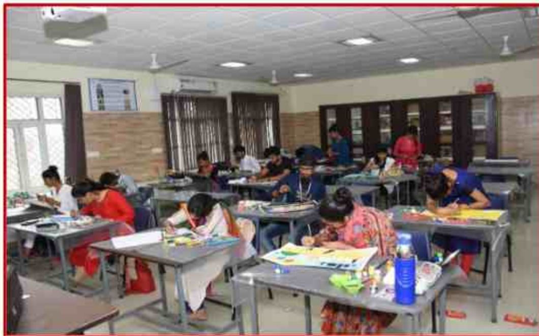
Student participating in on the spot painting competition during Youth Fest