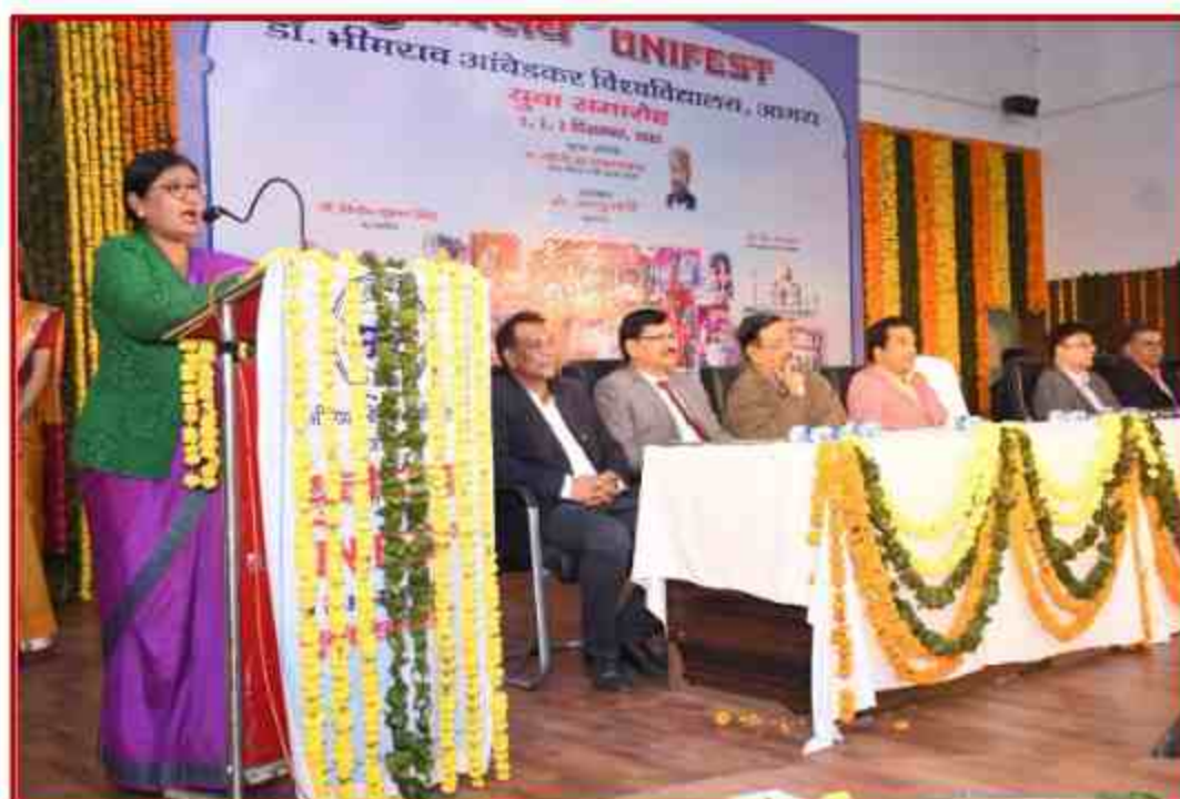
Youth Fest 2022