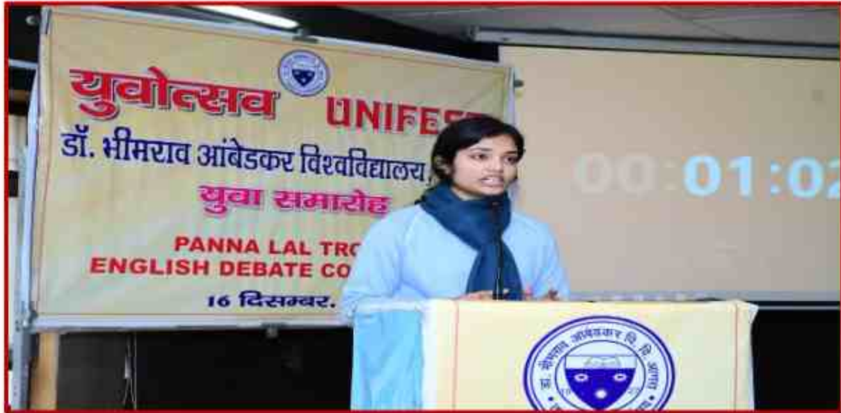
English Debate competition in Youth Fest