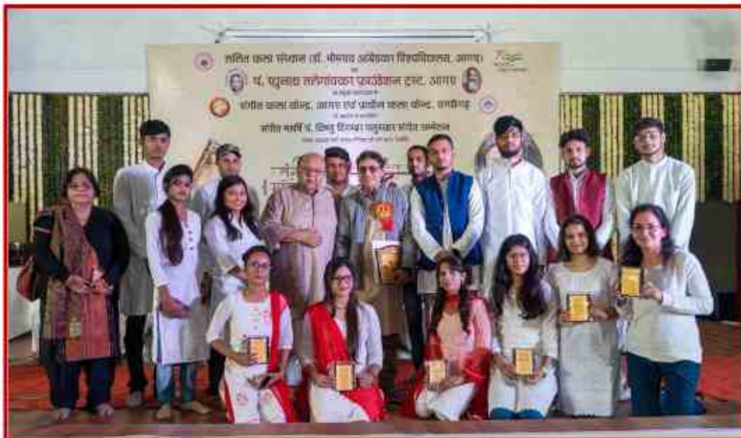
Student of Lalit Kala Sansthan in “Ninad Sangeet Mahotsav” at J.P.Sabhagar