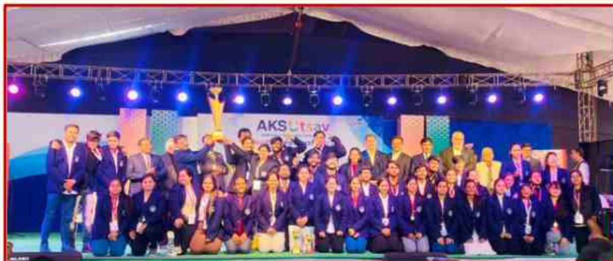
University team in Satana, 36 th Central Zone Inter University Youth Festival 2022