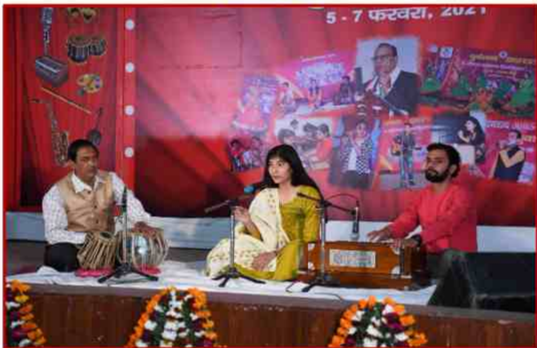
Student participating in Classical Singing during Youth Fest 2021 at J.P.Shabhagar