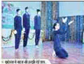
युवोत्सव में छात्रों की प्रस्तुति का दृश्य

For more news log on to: www.investix.com/agra