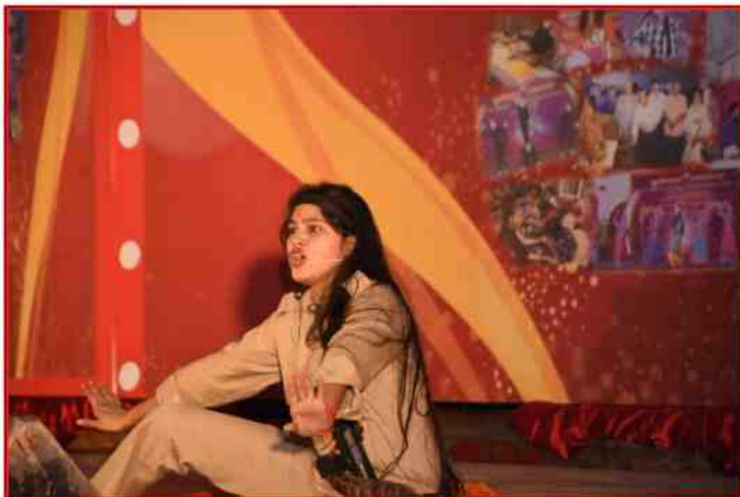
Student participant mono acting competition in Yuvotsav Samahroh 2019