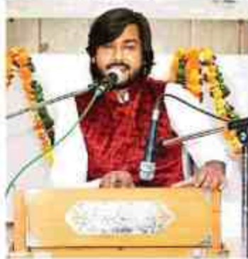
युवाकार डॉ. डा. भीमराव अम्बेडकर विश्वविद्यालय के छात्रों के रूप में जेपी सभागार में आयोजित युवोत्सव में एकल गायन की प्रस्तुति के दौरान छात्र-छात्राएं जबकि

जेपी सभागार, सेड परमचंद जीन संस्थान, स्कूल ऑफ लाइफ स्टडीस तक देवत संस्थान में सुष्म गायन(एकल), लीना गायन(एकल), माधव, एकल अभिनय, मिमिक्री, सिंटी चांद विक्ट प्रतियोगिता, स्पष्ट फोटोकारी, वाट्टीनिंग, बने मांडलिंग, भेड़टे और फिजिकल थिएटर प्रतियोगिता आयोजित हुई। तीन दिवसीय युवोत्सव का प्रतिष्ठा को समापन होगा।