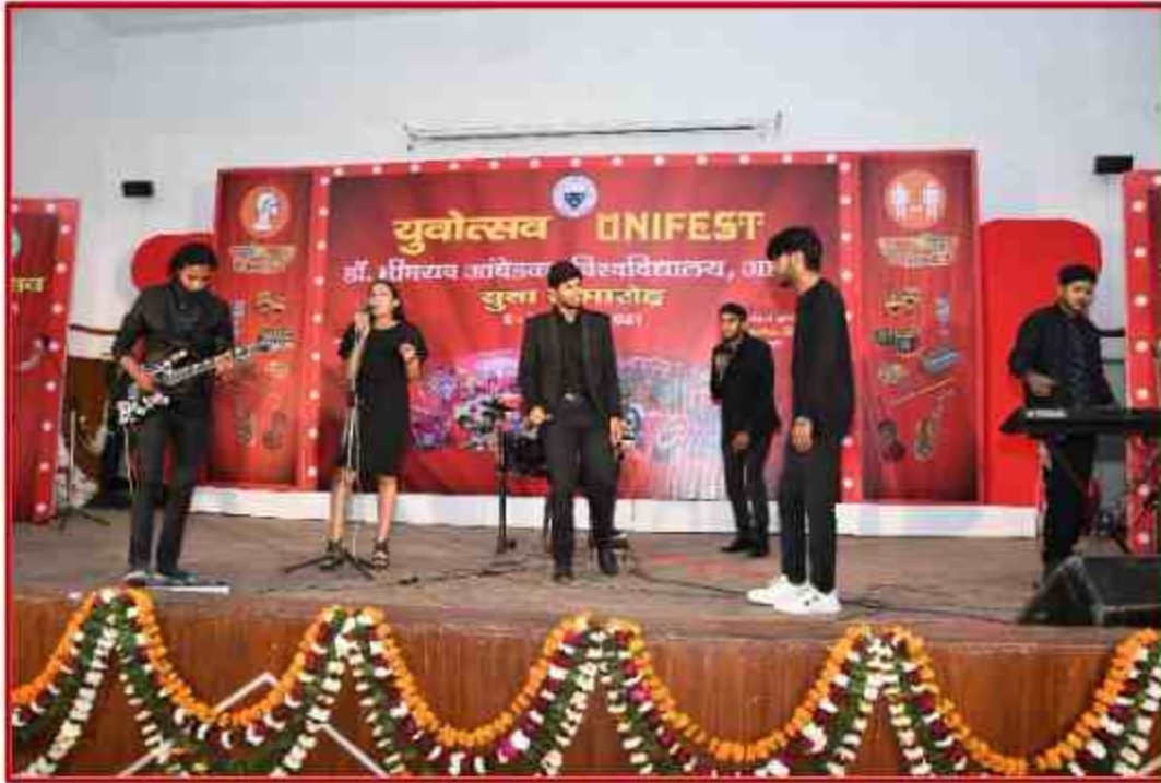
Student participant in Western Group Singing at J.P.Shabhagar