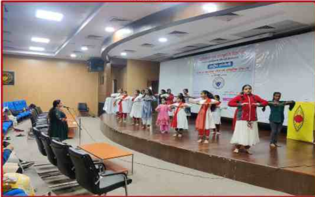
Student participant in Katthak dance workshop at Sanskriti Bhawan