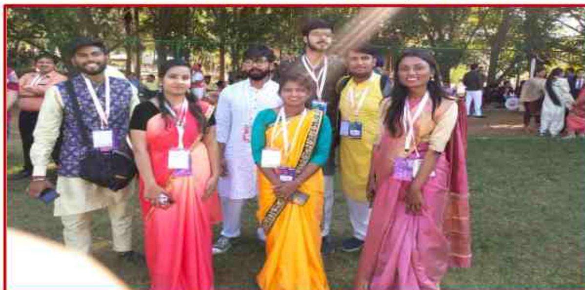
Winning university team in Bangalore, National Inter university Youth Festival 2022