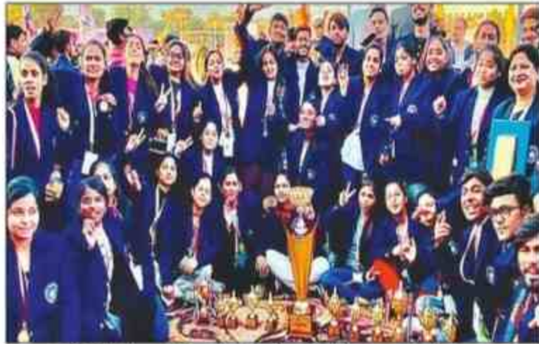
36वें केंद्रीय जोनल युवोत्सव के विजेता विद्यार्थी खुशी का इजहार करते हुए।