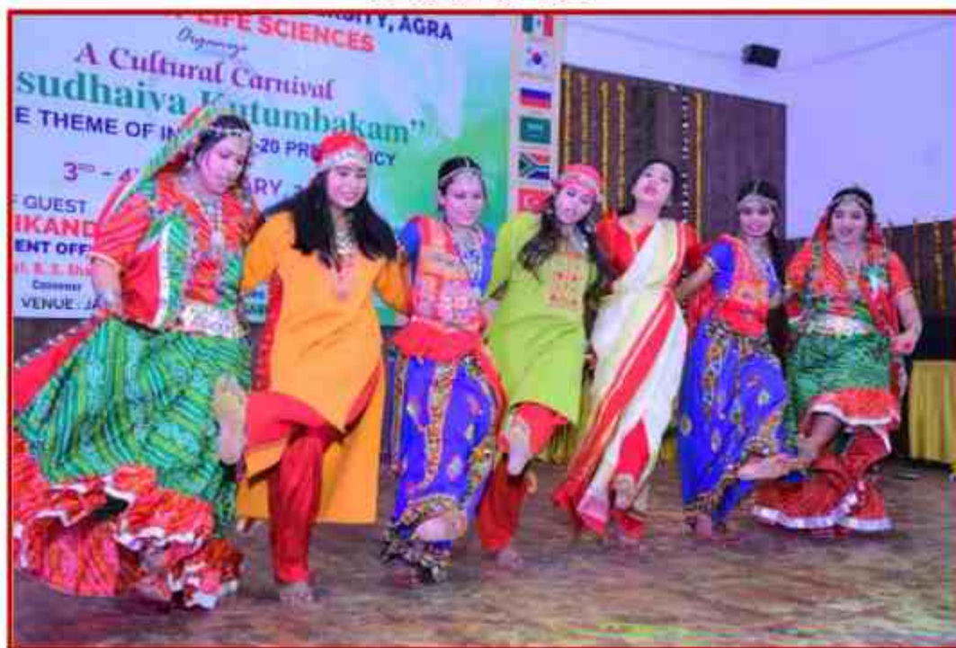
Student participant performance in Group dance at J.P.Sabhagar