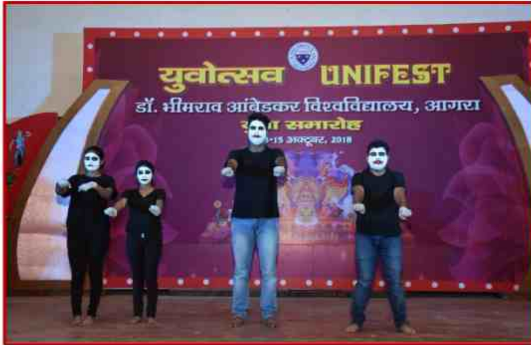
Student participant in Mime competition in J.P.Shabhagar, Yuvotsav Samahroh 2018