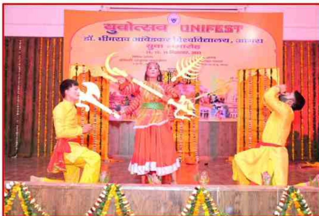
Student participant in Group dance competition in Youth Fest 2023