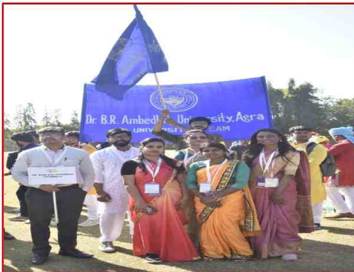
University team in Bangalore, National Inter university Youth Festival 2022