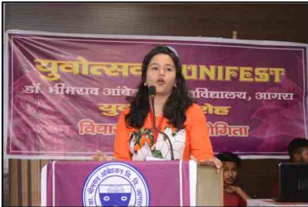
Student participate Elocution Vichar Ghosti Yuvotsav Samahroh 2018 at J.P.Shabhagar