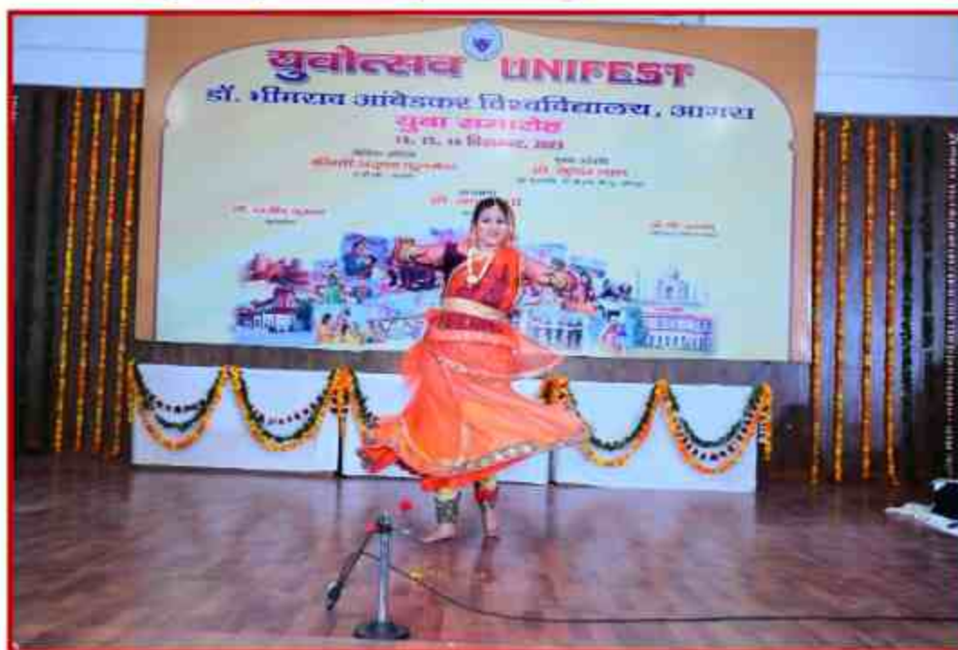
Student participant in Solo dance competition in Youth Fest 2023