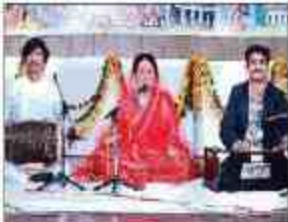
युवोत्सव में छात्रों की प्रस्तुति का दृश्य