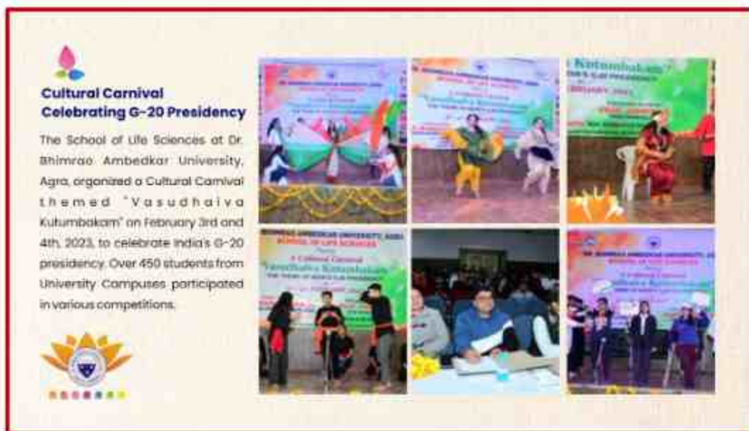
Student participant various performance at J.P.Sabhagar