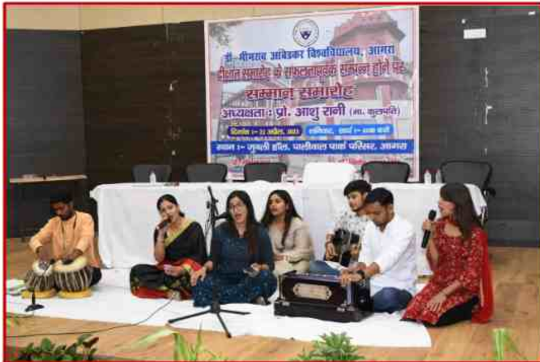
Student of Lalit Kala Sansthan performance at Jubli Hall at Paliwal park Campus