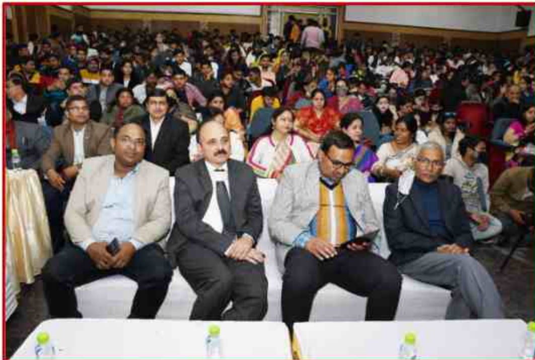
Audience at J.P.Sabhagar