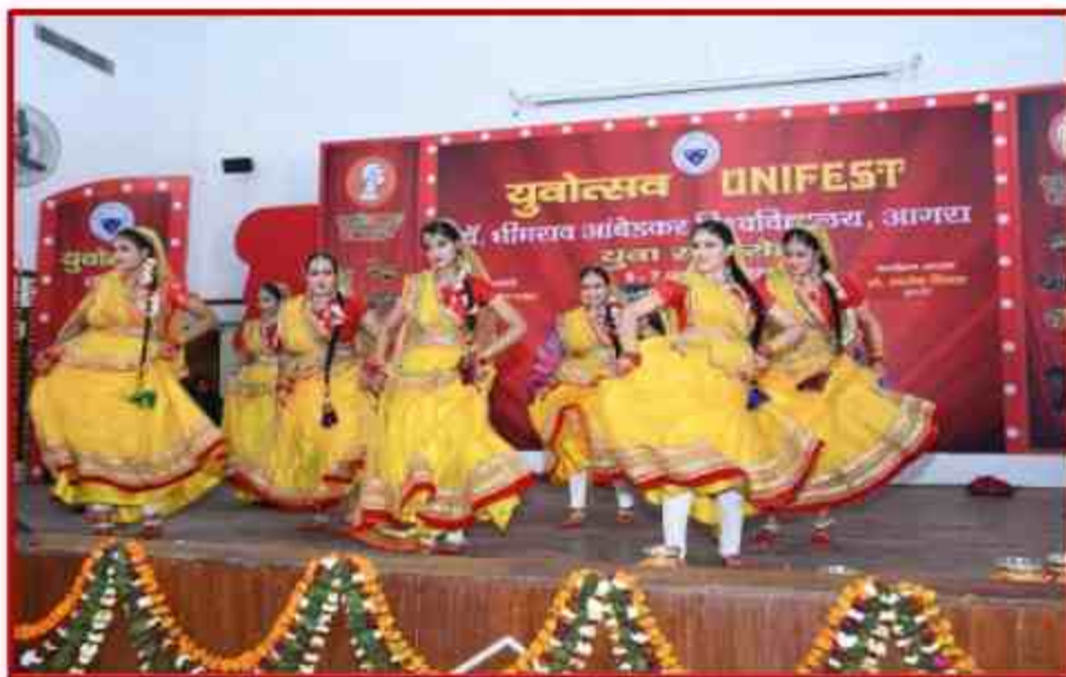
Student participant in Group dance competition in Youth Fest 2021 at J.P.Shabhagar