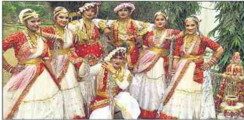
जेपी सभागार में युवोत्सव के सम्पन्न कार्यक्रम में प्रस्तुति देती छात्राएँ।