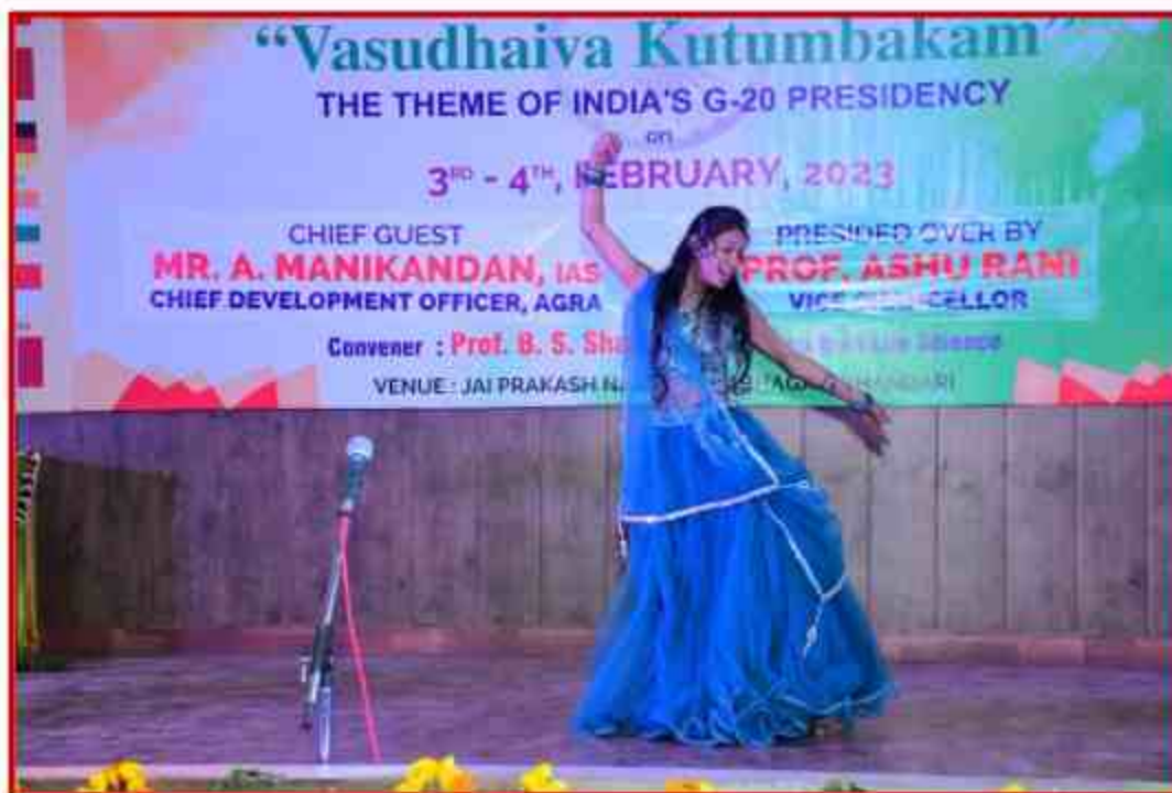
Student participant performance in Solo dance at J.P.Sabhagar