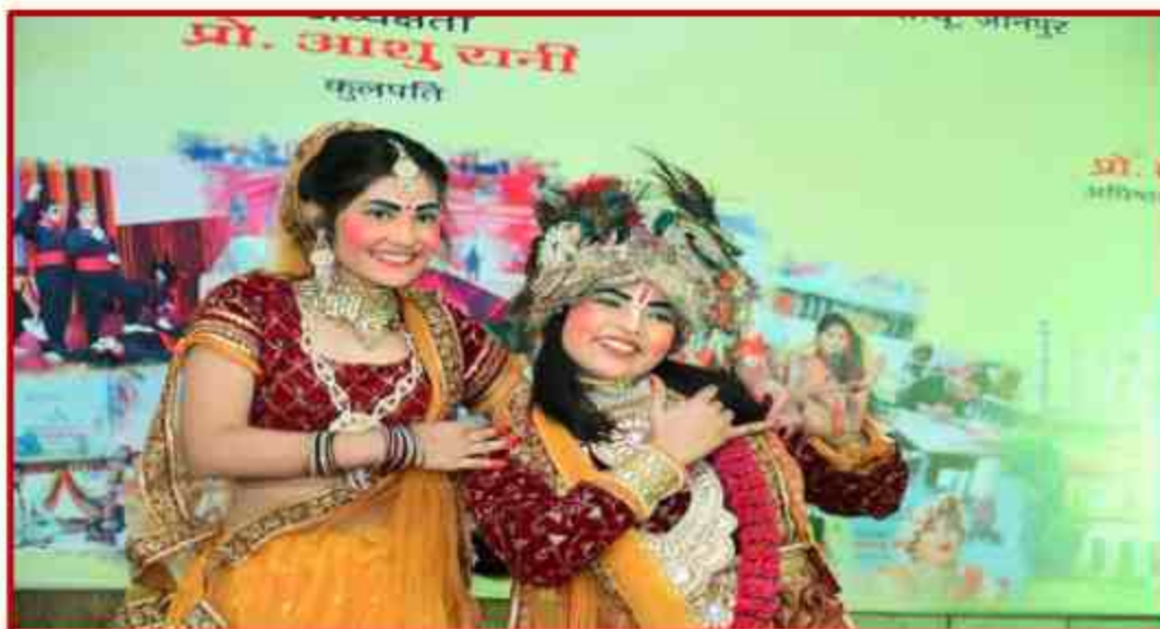
Student participant in Group dance competition in Youth Fest 2023