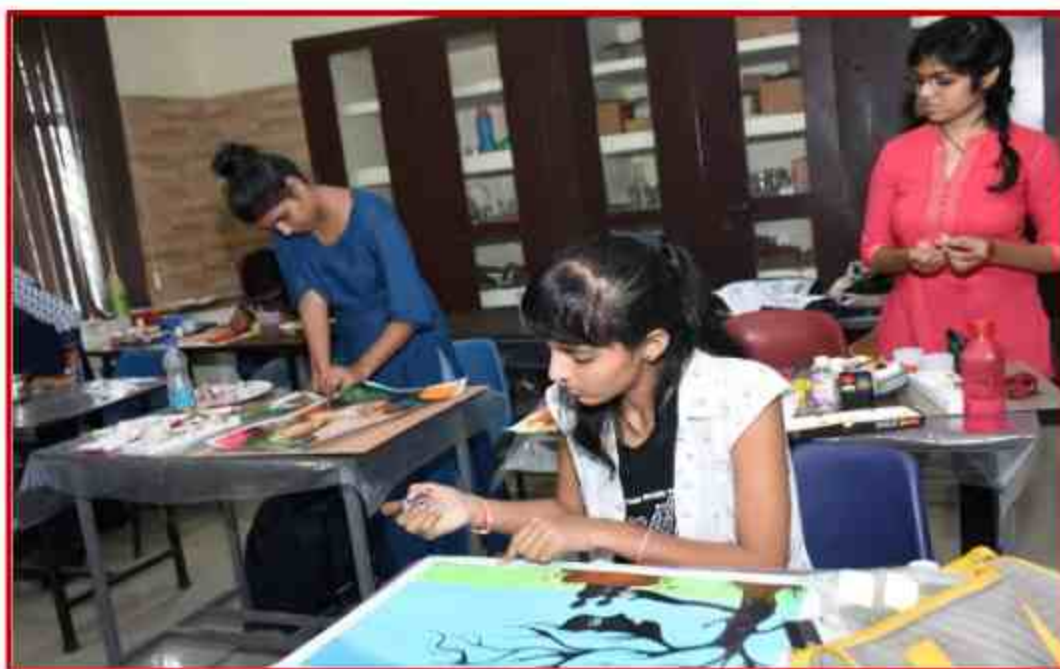
Student participating in on the spot painting competition during Youth Fest