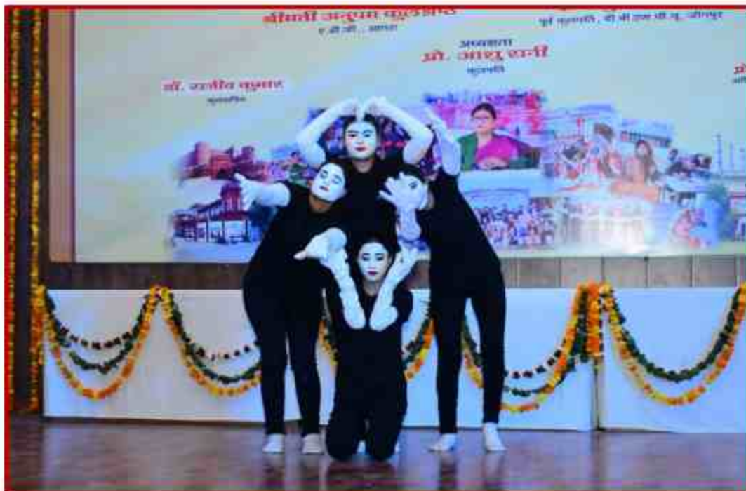
Student participant in Mime competition in Youth Fest 2022