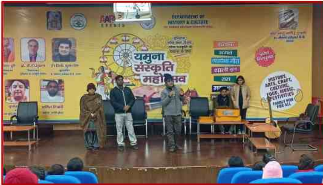
Yamuna Sanskriti Mahotsav at Sanskriti Bhawan