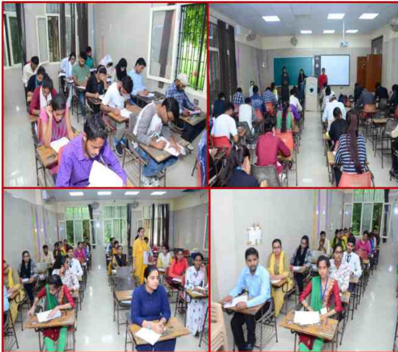
Student participating in Essay competition during Youth Fest at Daudayal Institute