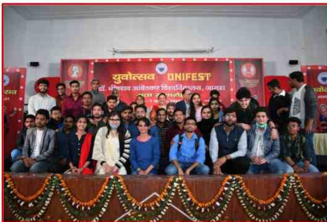
Student participant and winning prize in Yuvotsav Samahroh 2021 at J.P.Shabhagar