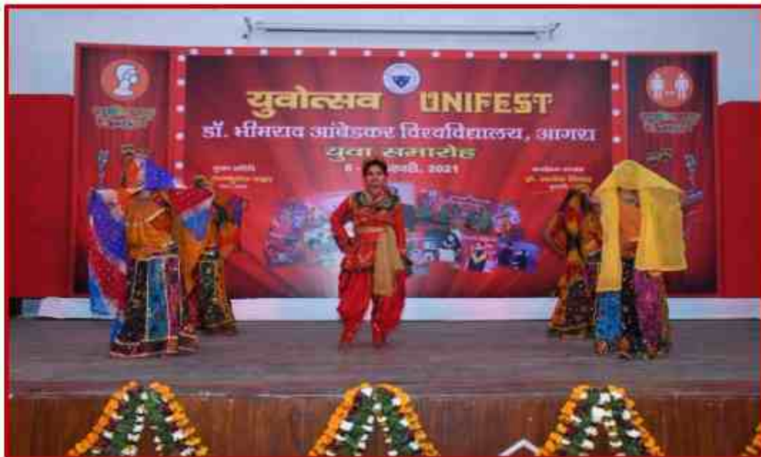
Student participant in Group Dance competition in Youth Fest 2021 at J.P.Shabhagar