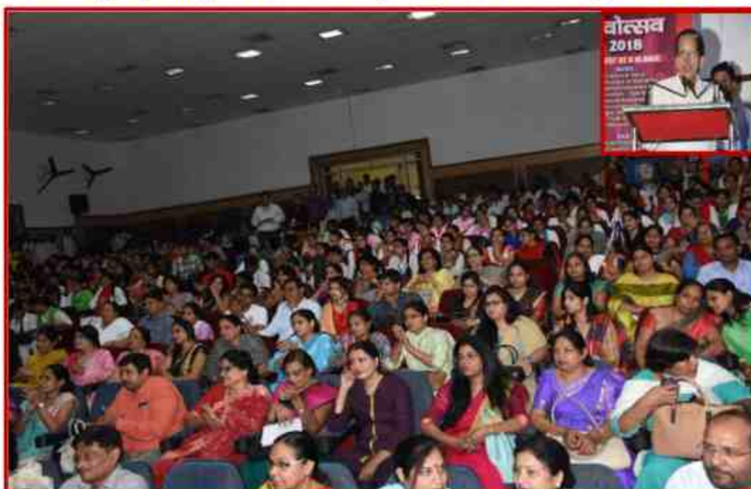
Student enjoying various competition in Yuvotsav Samahroh 2018