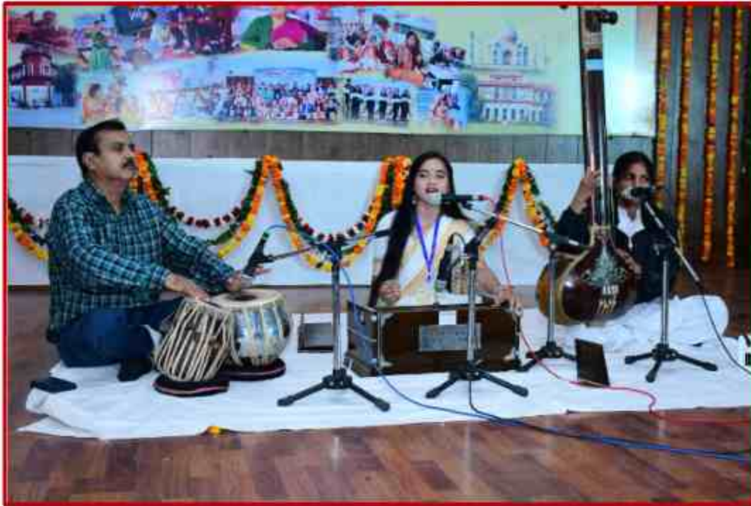
Student participant in Classical Singing competition in Youth Fest 2022 at J.P.Sabhagar