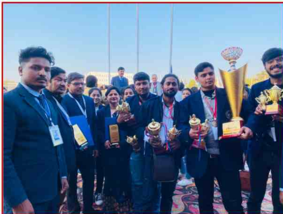
Winning University team in Satana, 36 th Central Zone Inter university Youth Festival 2022