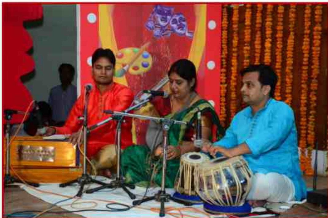
Student participant Singing competition in Yuvotsav Samahroh 2019