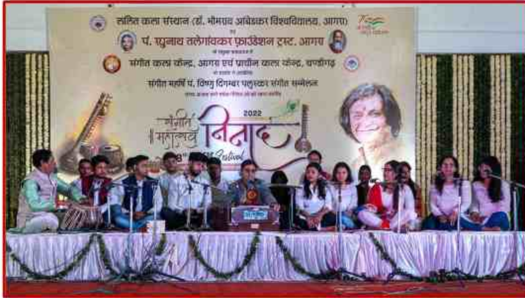
Student of Lalit Kala Sansthan in “Ninad Sangeet Mahotsav” at J.P.Sabhagar