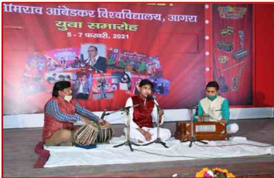
Student participating in Solo Classical singing competition during Youth Fest 2021 at J.P.Shabhagar