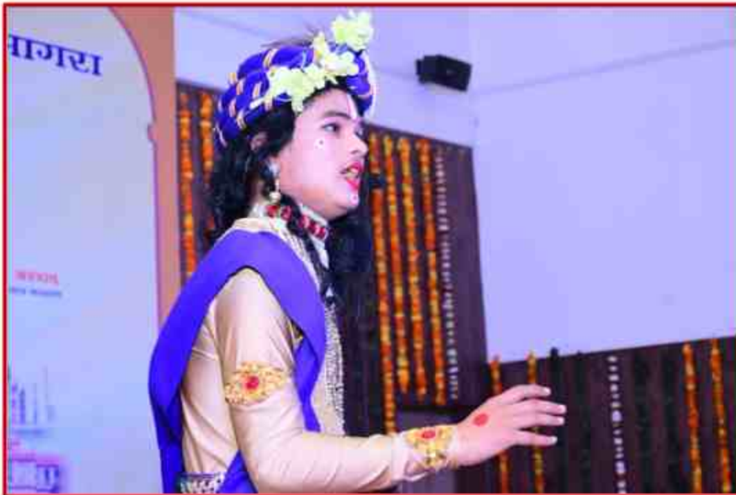
Student participant in Dancing competition in Youth Fest 2022 at J.P.Sabhagar