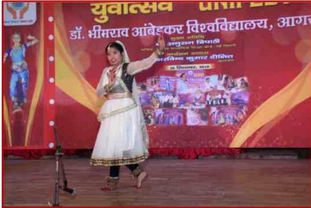
Student participant Dancing competition in Yuvotsav Samahroh 2019