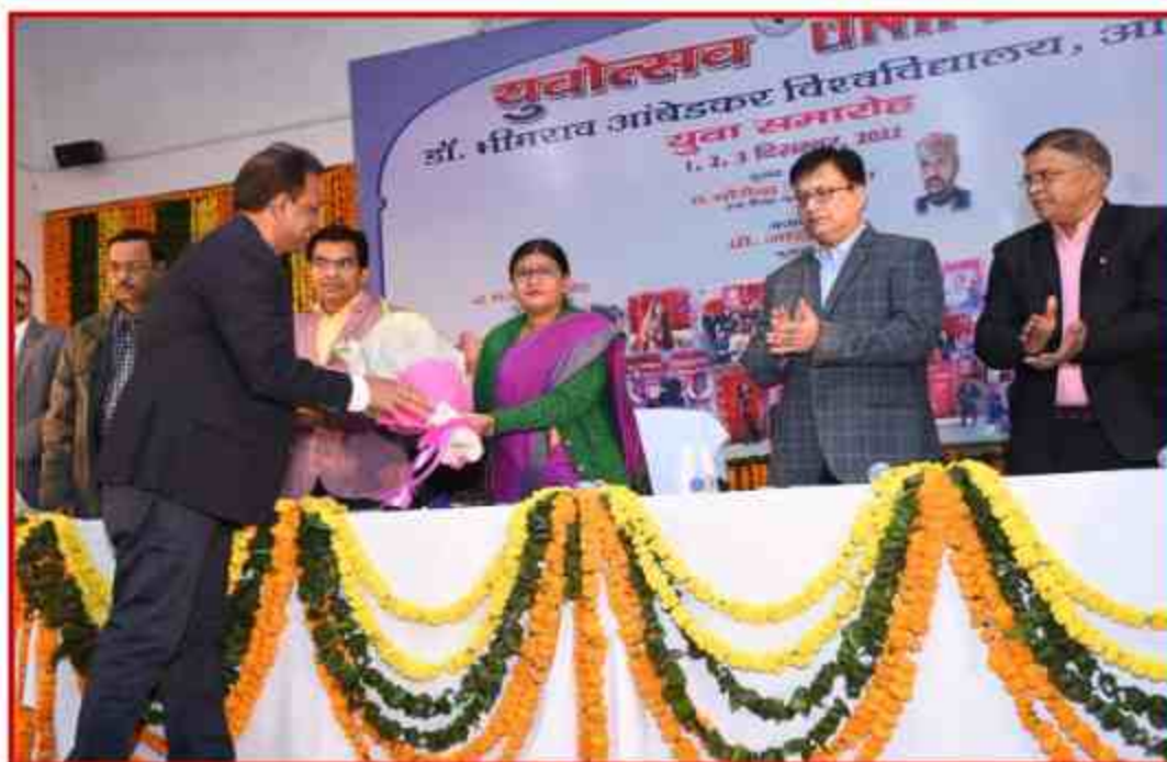
Inauguration Youth Fest 2022