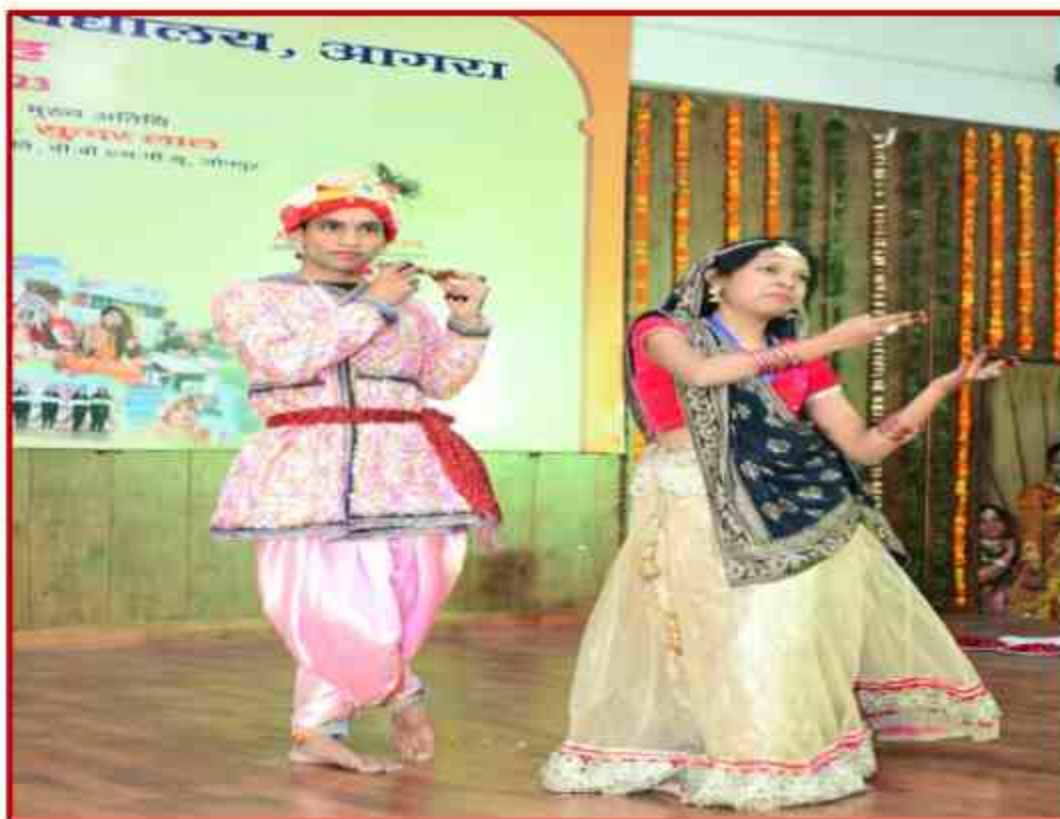
Student participant in Group dance competition in Youth Fest 2023