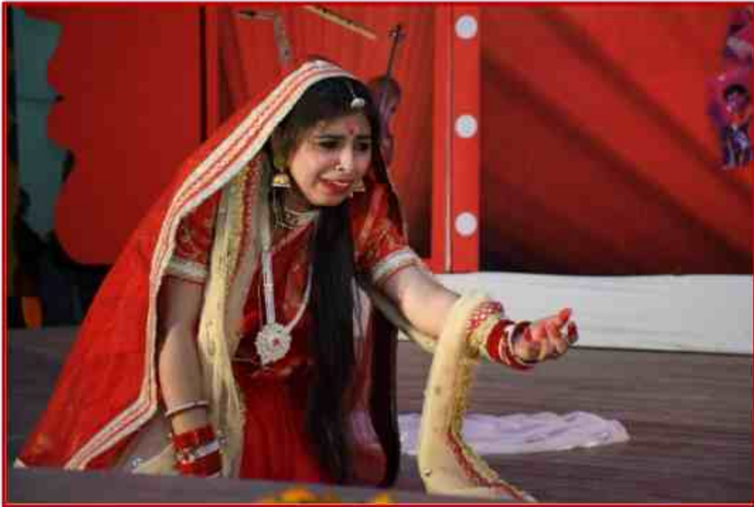
Student participant in Solo Dance competition in Youth Fest 2021 at J.P.Shabhagar