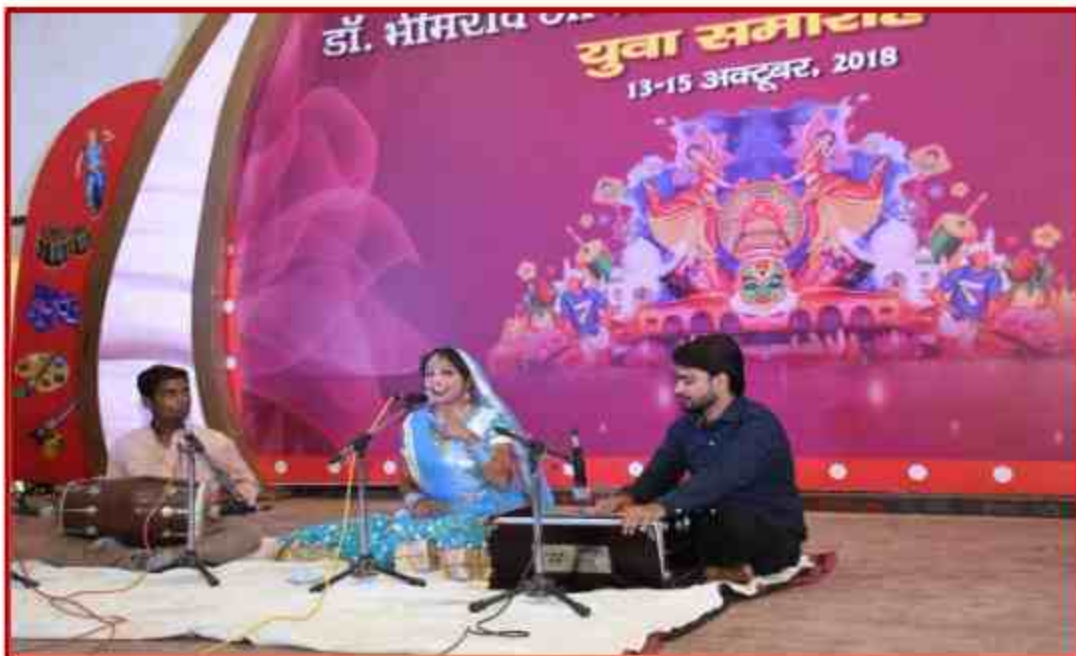
Student participant in Solo Singing competition in J.P.Shabhagar, Yuvotsav Samahroh 2018