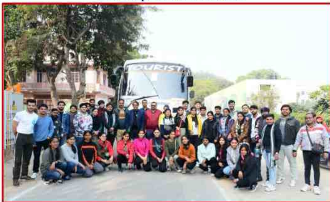
Departure of cultural team to Subharti University Meerut for Central Zone Inter University competition at Swami Vivekanand campus, Khandari