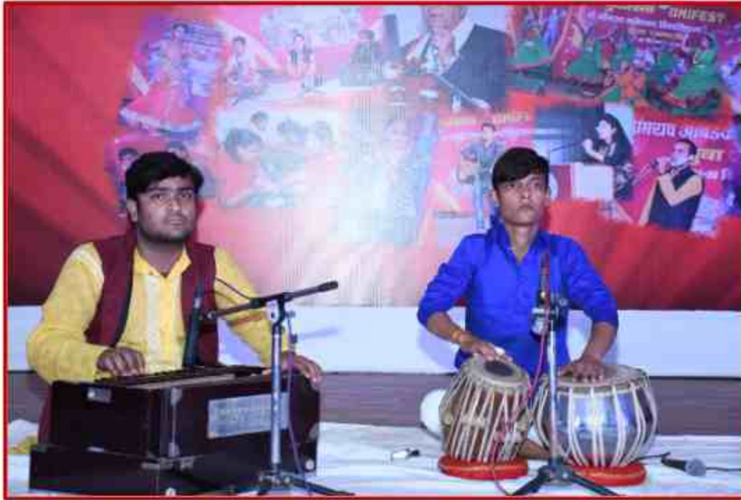
Student participate Tal vadya in Yuvotsav Samahroh 2021 at J.P.Shabhagar