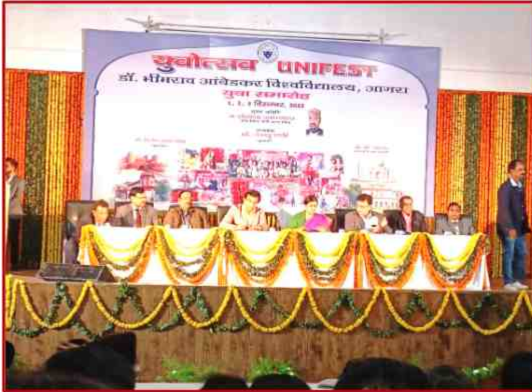
Youth Fest 2022