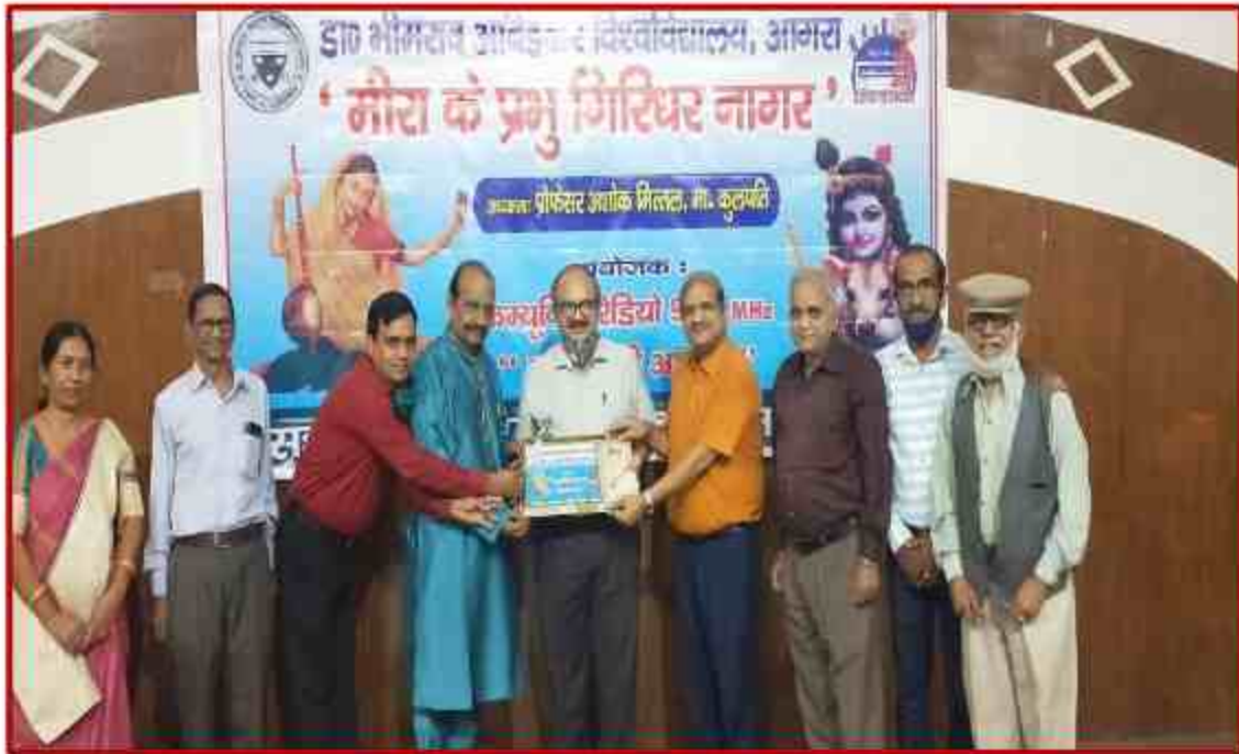
Cultural program of "Meera Ke Prabhu Giridhar Nagar" at J.P.Sabhagar by Community Radio