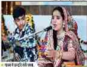
युवोत्सव में छात्रों की प्रस्तुति का दृश्य