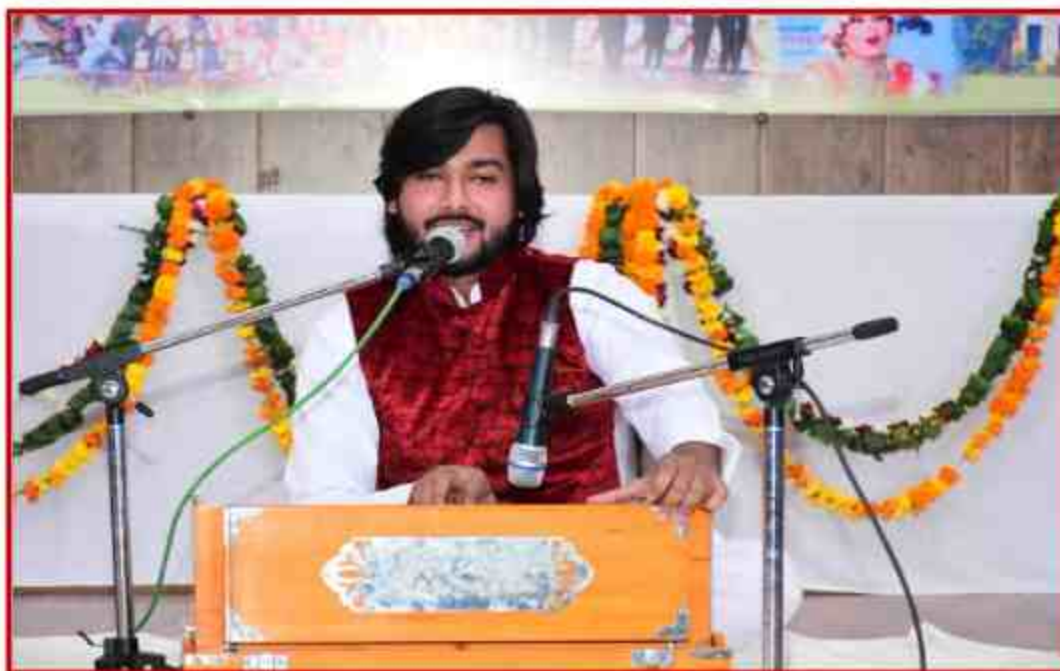
Student participant in Singing competition in Youth Fest 2022