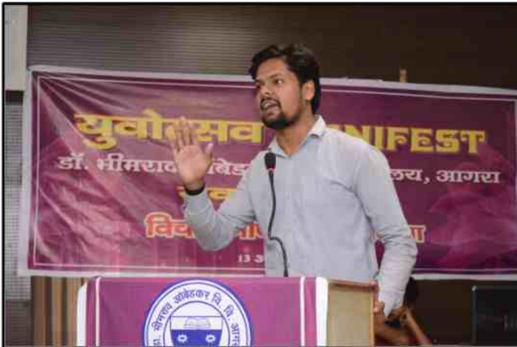
Student participate Elocution Vichar Ghosti Yuvotsav Samahroh 2018 at J.P.Shabhagar