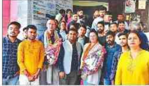
केएमआई में इस से आर सफलतापूर्वक के साथ विद्यार्थी। संके