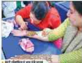
युवोत्सव में छात्रों की प्रस्तुति का दृश्य