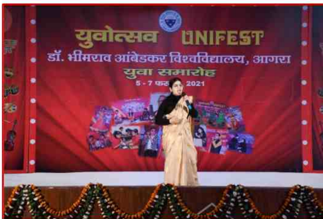
Student participant in Mimicry competition in Youth Fest 2021 at J.P.Shabhagar