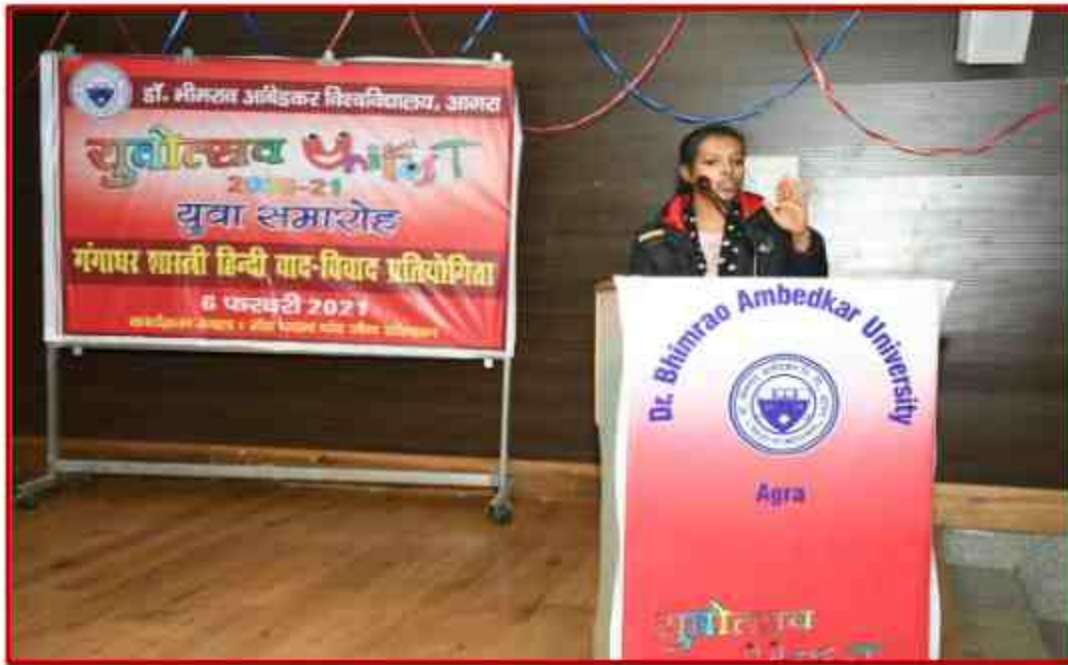
Student participating in Hindi Debate competition during Youth Fest 2021