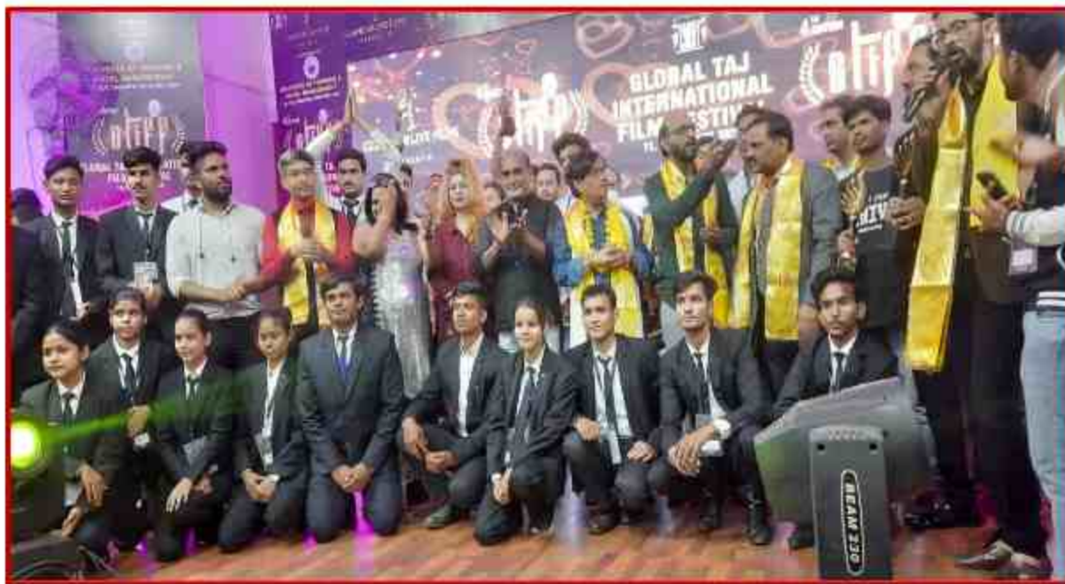
Student of different departments participate in Global Taj International Film Festival at J.P.Sabhagar