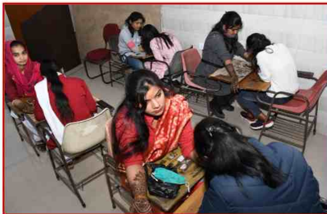
Mehndi competition in Youth Festival at SPCJ Institute