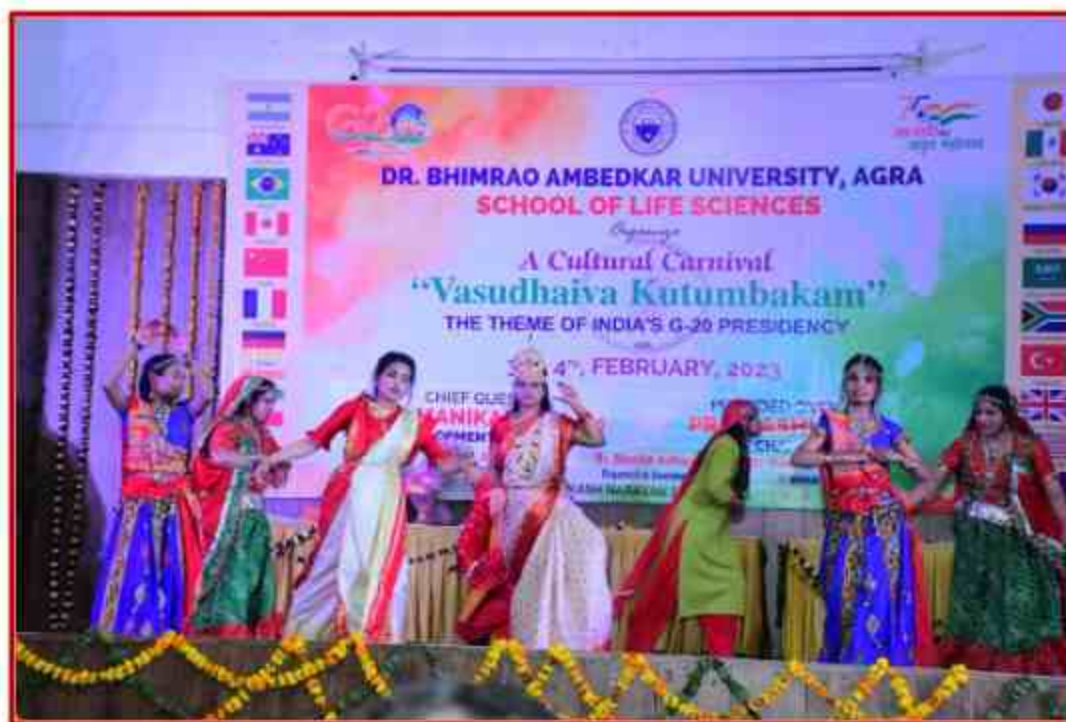
Student participant performance in Group dance at J.P.Sabhagar