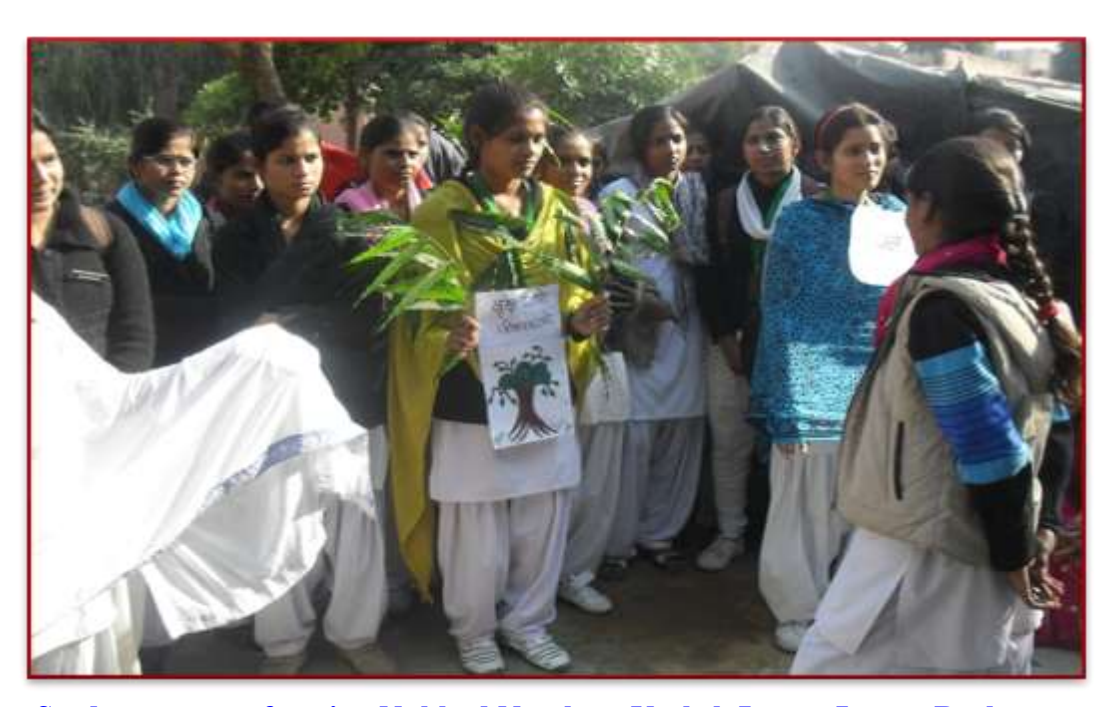
Students are performing Nukkad Natak on Vreksh Lagao Jeevan Bachao at slum areas of Agra 05/06/2022"