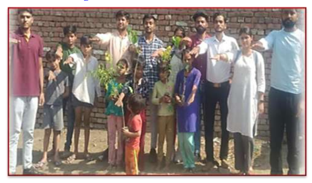
The villagers solemnly oath to protect and preserve the environment