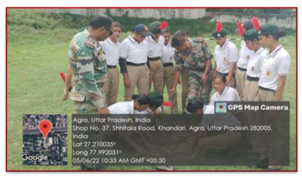
NSS volunteers are actively participating in a plantation activity near the locations of Khandari to commemorate World Environment Day