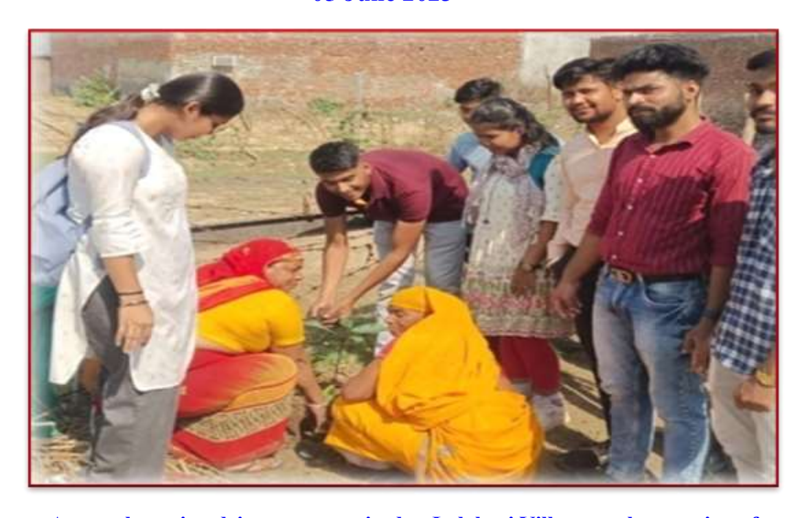
A tree plantation drive was organized at Lalghari Village on the occasion of World Environment Day

Plantation Activities on "World Environment Day" 05 June 2023