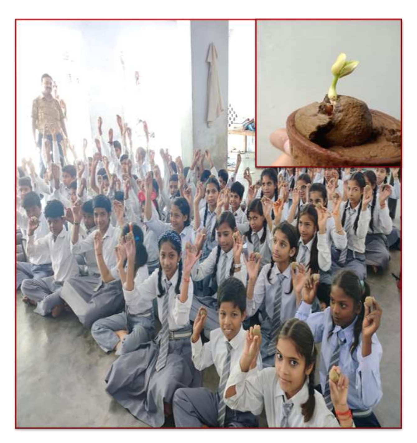
A Seed Bomb Awareness Initiative Flourishes in Schools on Environment Day

Awareness activity on Seed Bomb: An innovative way of plantation 05 June 2023