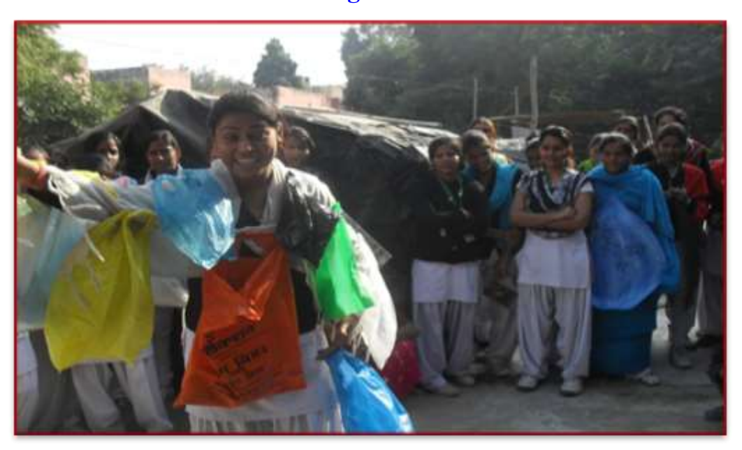
Students are actively performing Nukkad Natak on "Say No to Plastic" at slum areas of Agra 03/08/2021