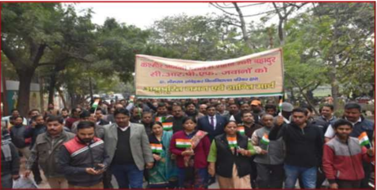
Participation of staff and students in Peace and Salute March to support Central Reserve Police Force