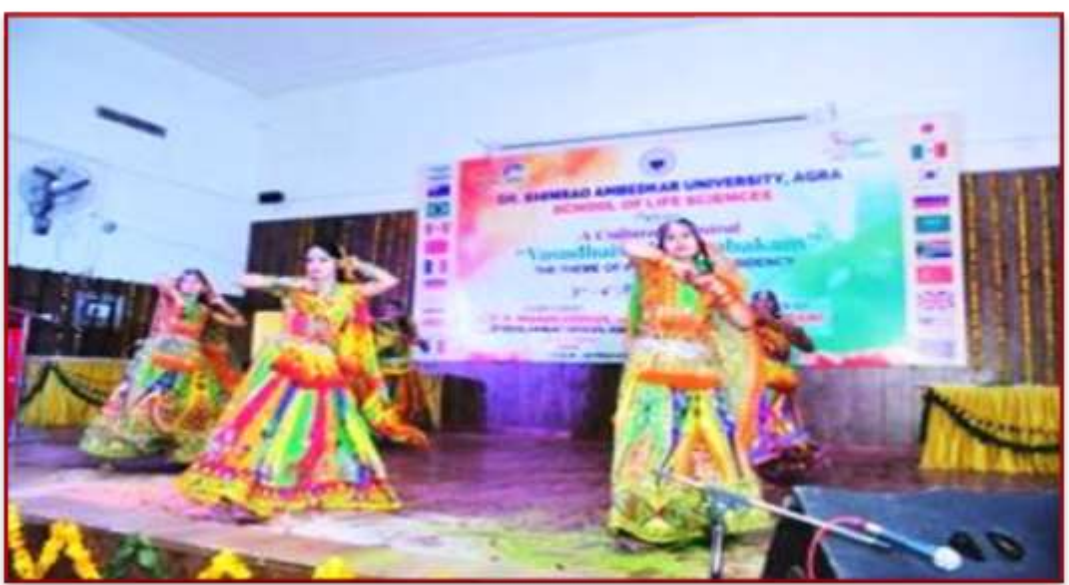
Students showcasing their dance skills at Jai Prakash Narayan Sabhaghar, Khandari under Cultural Carnival organised under Vasudhaiya Kutumbakam