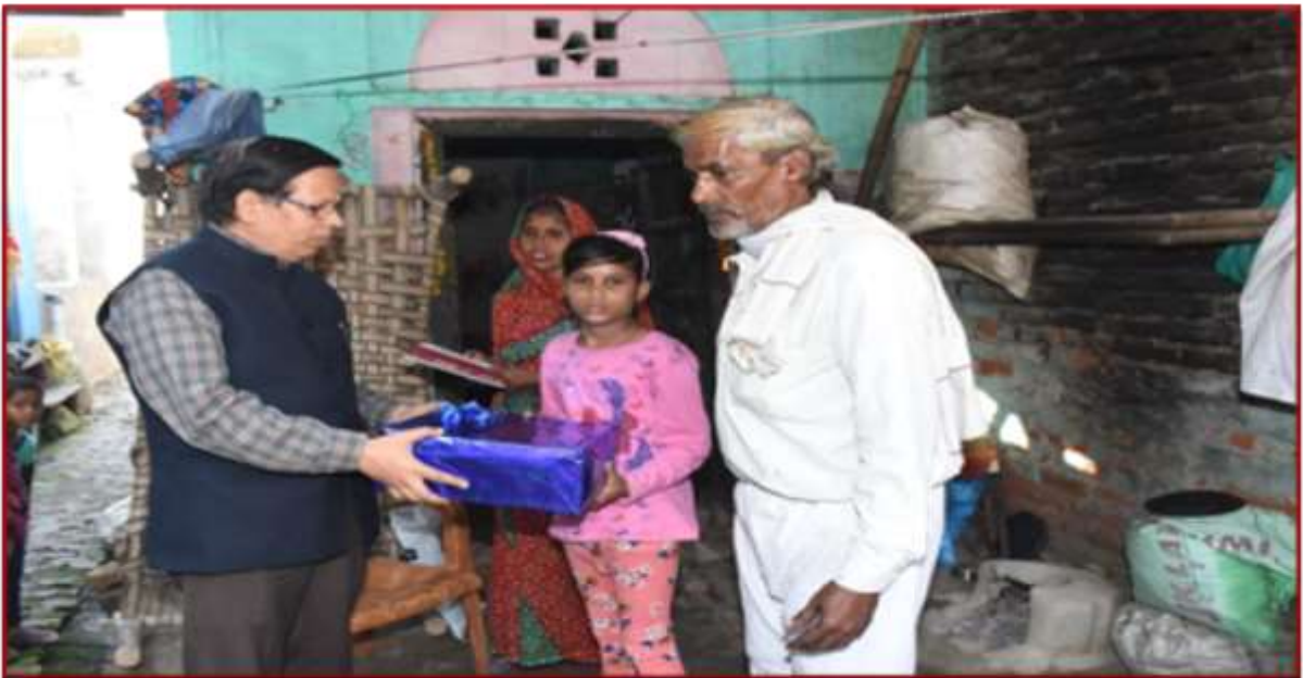
Social Outreach Program, Primary School of Kanskhar Bimanagar, Hariparwat Was Adopted (2018)