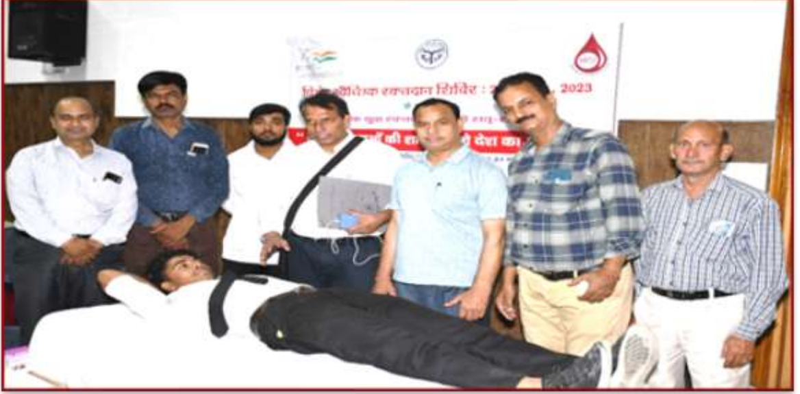
Special Blood Donation Camp, Student Welfare Department, Total of 42 Unit of Blood Collected