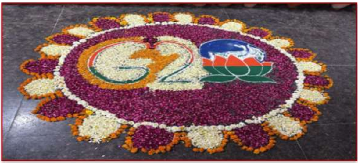
Honorable Vice Chancellor visited to admire students' Rangoli-making skills on G-20