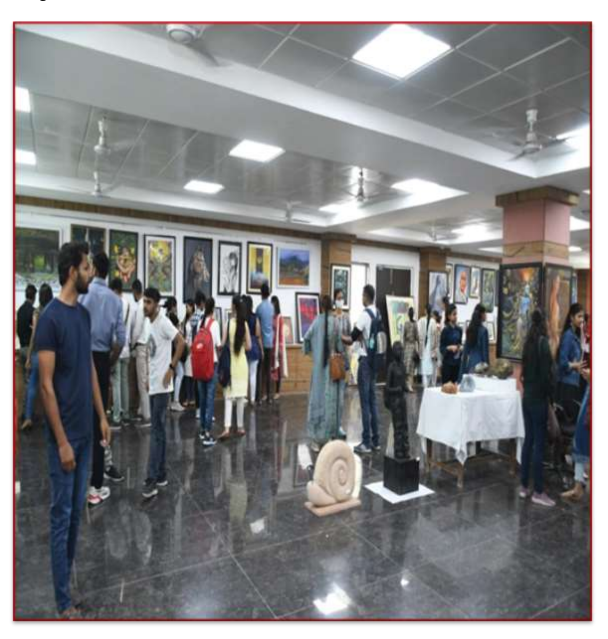
"Regional Art Exhibition" Joint Auspices of Sate Lalit Kala Academy and LKI on 22-23 May 2023

"Regional Art Exhibition" serves as a vibrant showcase of the diverse talents and perspectives within the university, enriching the cultural landscape of the region and inspiring creativity among students and attendees alike.