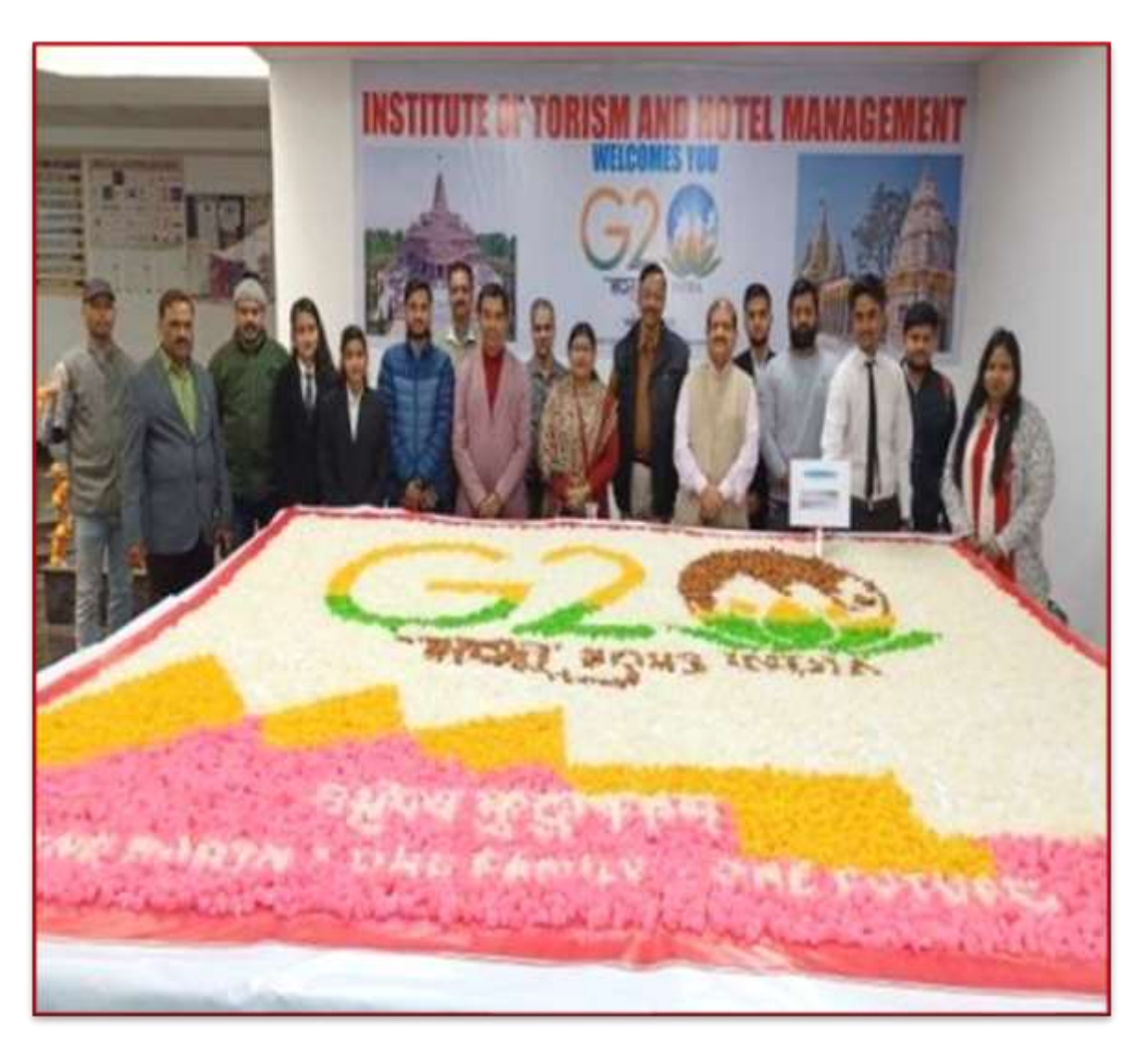
"Petha Rangoli and Beautification" Students from the Institute of Tourism & Hotel Management created the world's largest Rangoli from Petha at Sanskriti Bhawan.

The students of the university have achieved a remarkable feat by creating the world's largest "petha" rangoli. This colorful masterpiece showcases the creativity and collaborative spirit of the student community, as they come together to celebrate their cultural heritage and showcase their artistic talents on a grand scale.