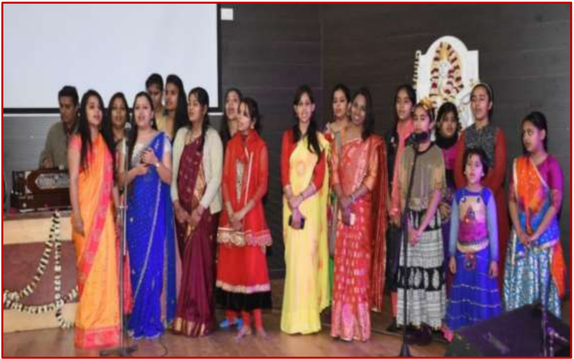
Students showcasing their outstanding talents through music, dance and drama performances at University Cultural Program