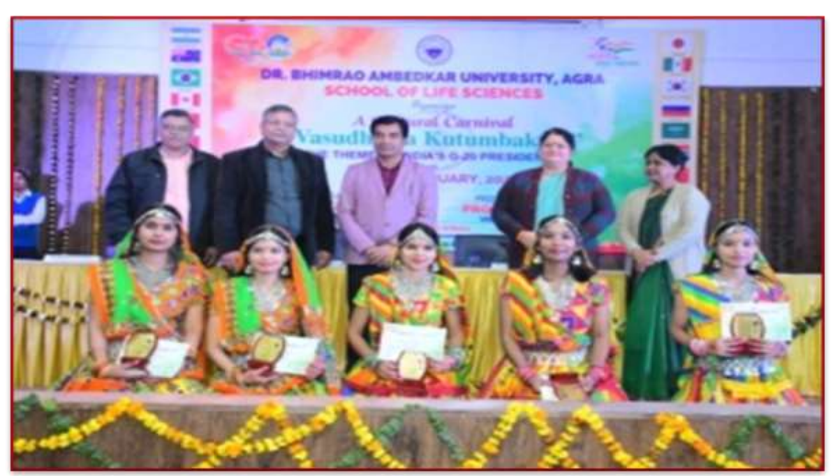
'Cultural Carnival' Valedictory Function & Award Distribution (3-4, FEB 2023)