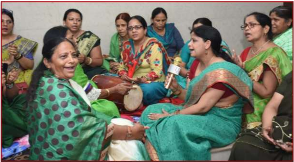
Celebration of Hariyani Teej among faculty members