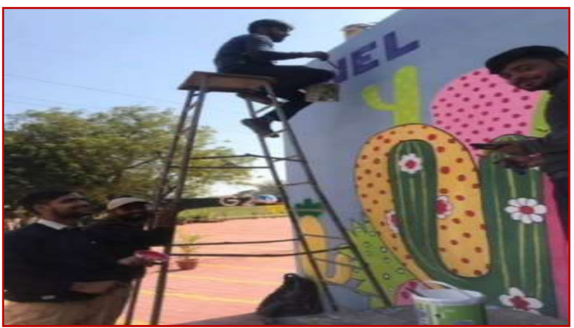
Beautification of Agra City and the University Campus by Students of Lalitkala Sansthan during G-20 Summit.