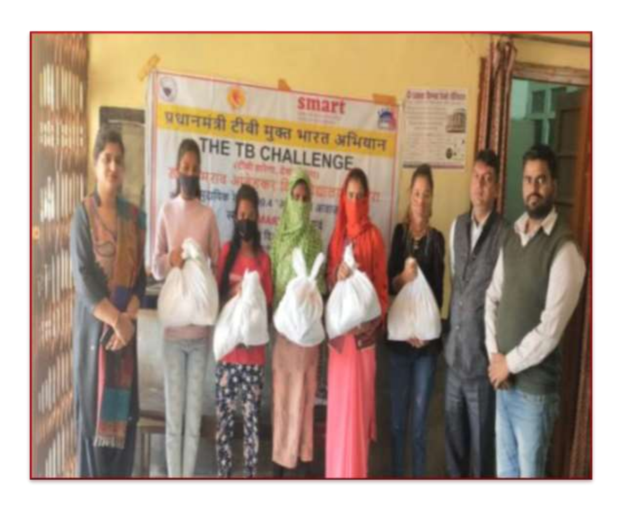
Poshan Potali distribution to the adopted TB patients

The university took a compassionate initiative by distributing "Poshan Potali" to patients suffering from Tuberculosis (TB). Recognizing the critical role of nutrition in combating TB and aiding recovery, these kits were meticulously curated to provide essential dietary support alongside medical treatment. Each kit contained a thoughtful selection of nutrient-rich foods, supplements, and educational materials aimed at empowering patients to maintain a balanced diet and support their journey towards better health.