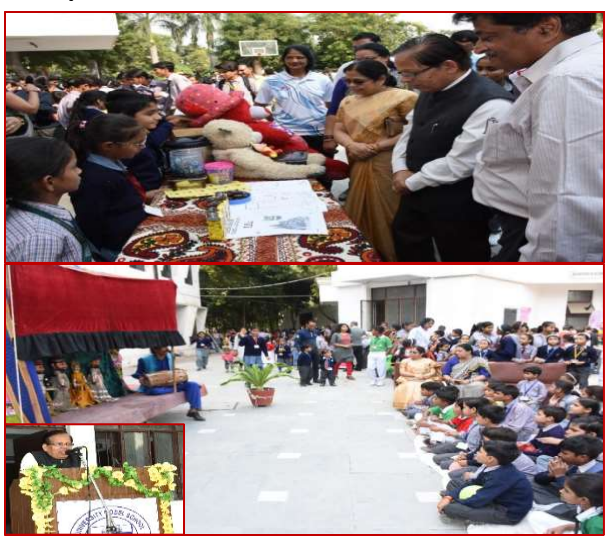
Holistic education and cultural enrichment through cultural program at University Model School

The Cultural Program at University Model School is a vibrant showcase of the diverse talents and cultural heritage of its students. Through colorful performances, artistic displays, and creative presentations, the program celebrates the rich tapestry of traditions and talents within the school community. It serves as a memorable and enriching experience for all involved, reinforcing the school's commitment to holistic education and cultural enrichment.