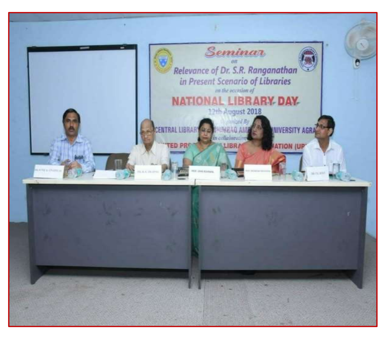
Seminar organised on National Library Day emphasizing role of libraries in education, research and development

The university has organized a seminar on the occasion of National Library Day, emphasizing the importance of libraries as vital institutions for knowledge dissemination and intellectual growth. This event serves as a platform for discussions, presentations, and reflections on the role of libraries in fostering literacy, education, and lifelong learning.