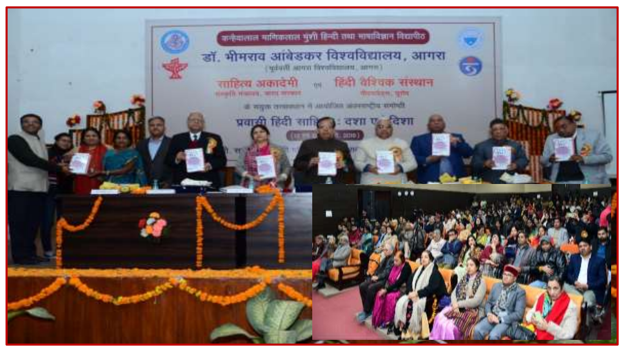
2 day international conference hosted on Pravashi Hindi Sahitya in the presence of board members