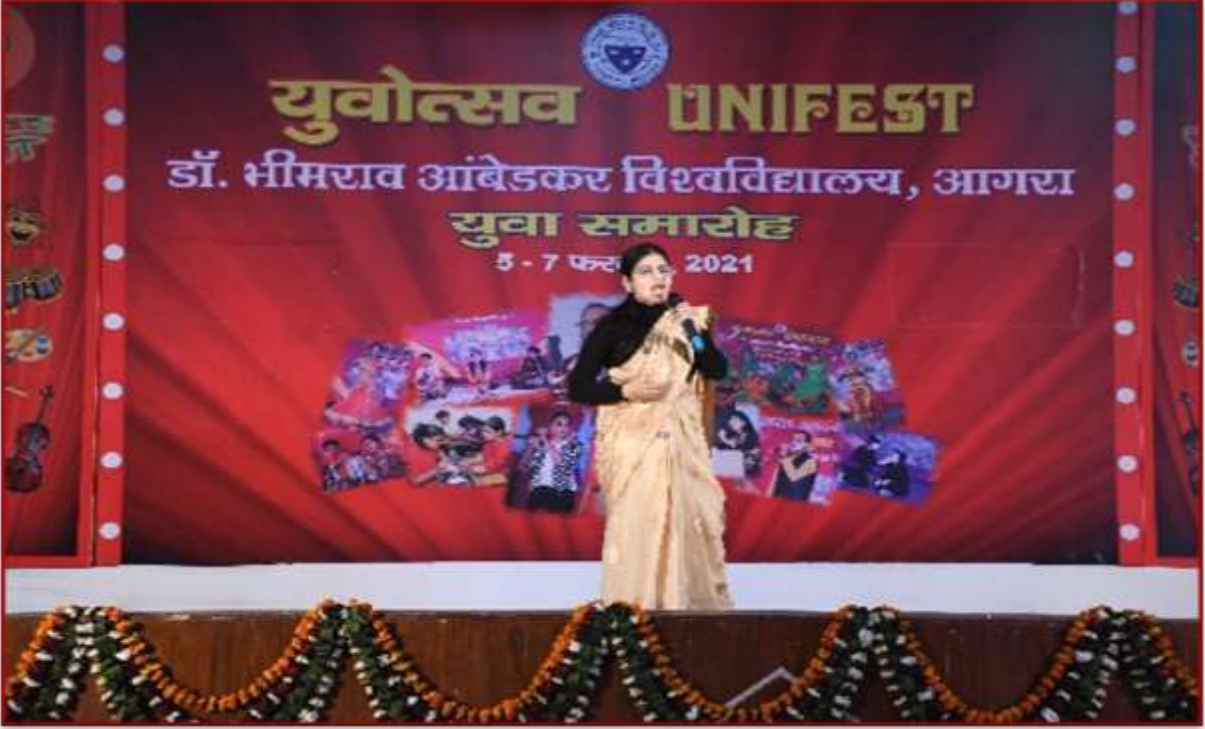
UNIFEST - 'Yugoslavia Mahotsav'