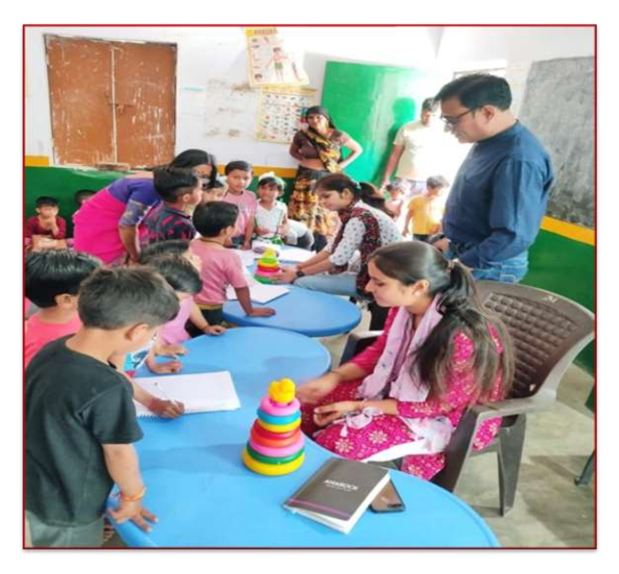
Students of ISS teaching Anganwari Centre children in Naglatalphi Anganwari Centre

The university has taken proactive steps to extend its educational outreach beyond the confines of its campus by actively participating in teaching activities at Anganwadi centers. Recognizing the pivotal role these centers play in early childhood education and development, university faculty and students have volunteered their time and expertise to support the learning needs of young children in the community. This collaborative effort not only enriches the educational experience of the children but also strengthens the university's commitment to serving the broader community and fostering lifelong learning opportunities for all.