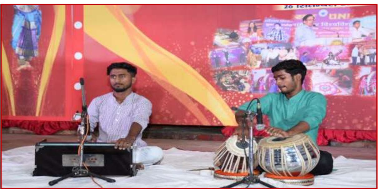
Students enchant Yuva Mahotsav with their classical solo dance and singing performances