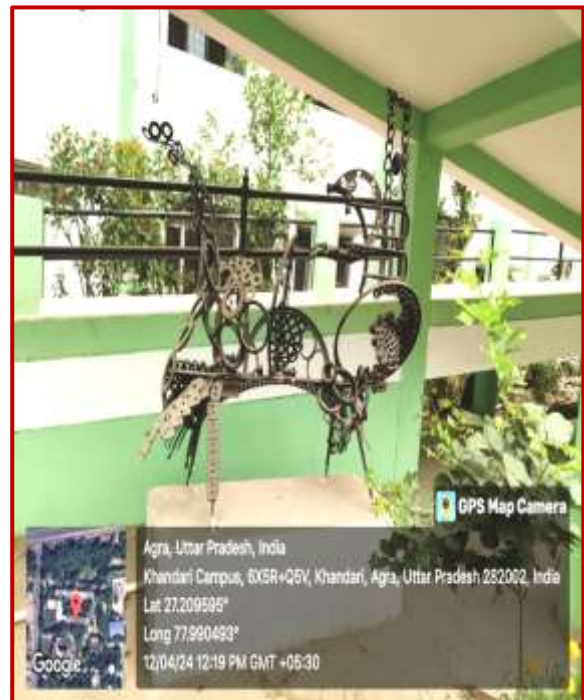
Abstract, Gauri Gangan Worth Rs. 4 Lacs