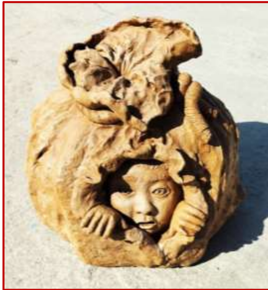
Terracotta Clay Art Worth Rs. 25k