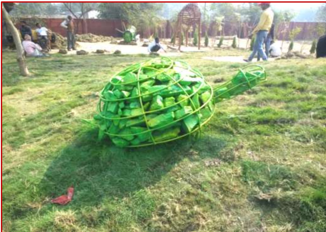
Tortoise 5 Ft length by Brijesh Chandel (BFA) Cost Worth Rs.80k

Scrap metal artifacts of prepared by students and faculty of university at waste to wonder park, Fatehabad road, Agra