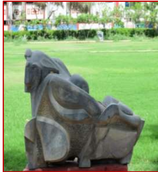
Baislana Black marble sculpture Worth Rs. 5 Lacs