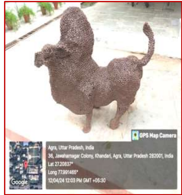
Bull, Uttam Prachrne, Worth Rs. 6 Lacs