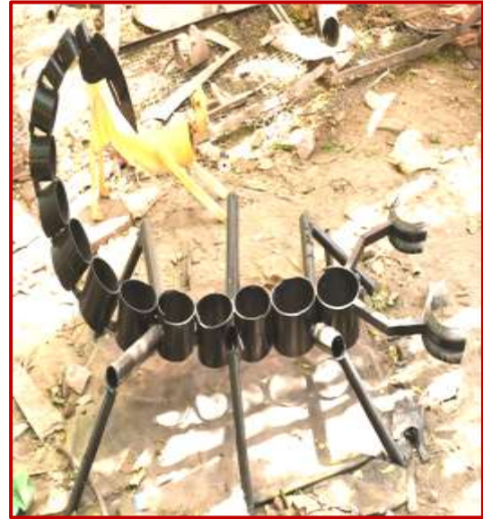
Scorpion 4.10x2.9x2.3ft., Dinesh Chahar(BFA) Worth Rs. 80k