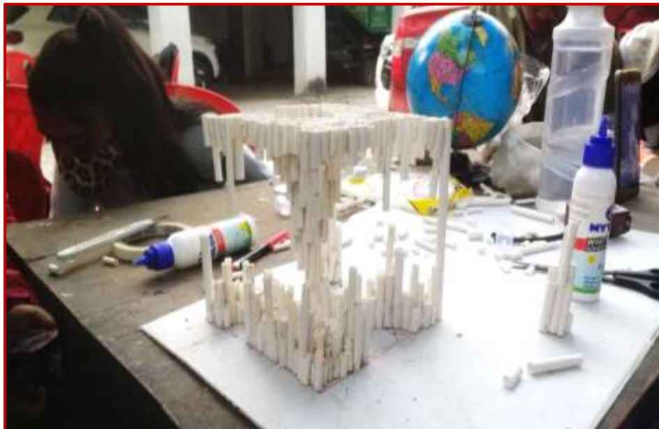
Straw Maquette for Melting Ice Cube sculpture