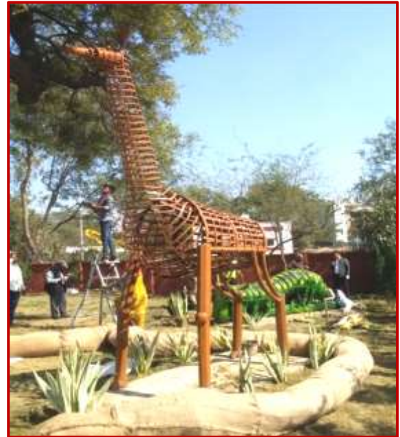
Giraffe 8x3x12 ft, Abhi (MFA), Charul ( BFA ), Mahak(BFA) Worth Rs. 6 Lacs