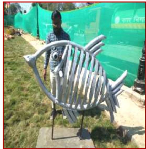
Fish 4x1x3ft, Ravi Dube(MFA) Worth Rs. 1 Lac