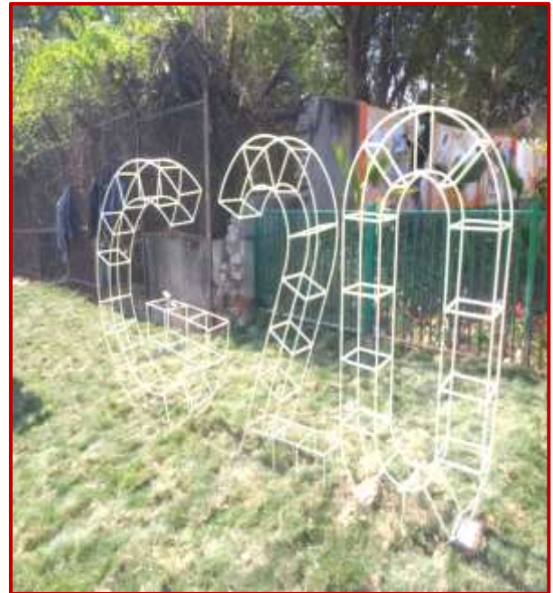
G20 5x7x1 ft., Paras and Dinesh (MFA) Worth Rs. 1 Lac