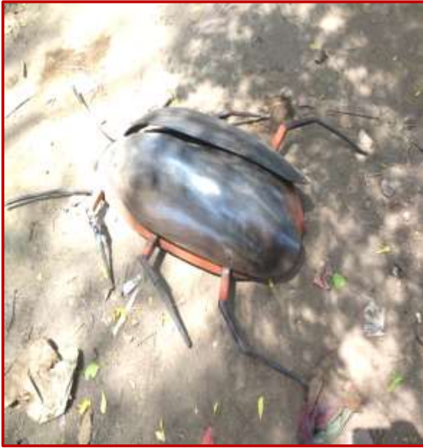
Cockroach by Charul & Anjali (BFA) Worth Rs. 50k