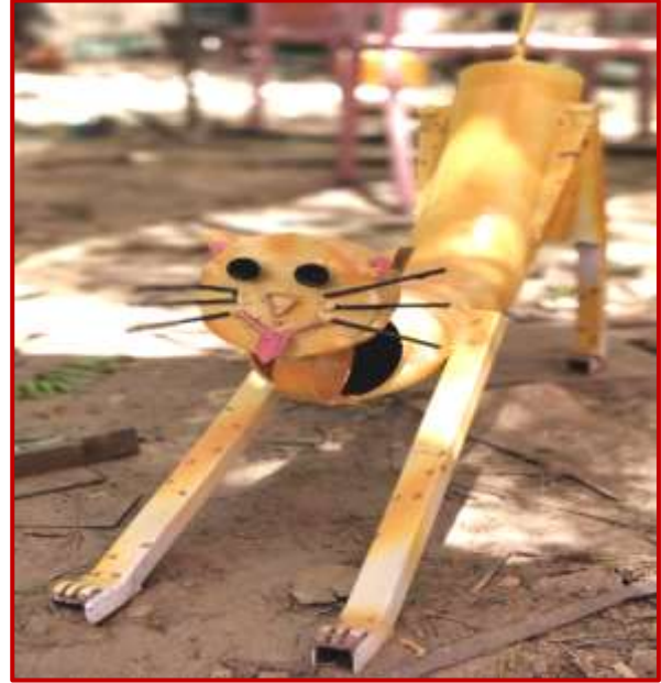
Cat 2.5x2.7x0.7ft., Prachi(BFA) Worth Rs. 60k