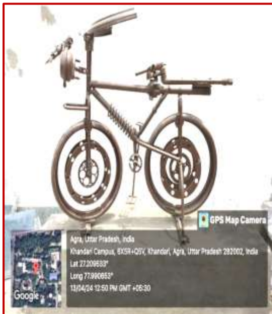
Cycle, Lavi Gupta, Worth Rs. 1 Lac