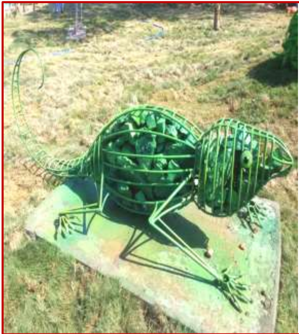
Chameleon by Abhishek(MFA) and Dinesh(BFA) Worth Rs. 1.5 Lacs