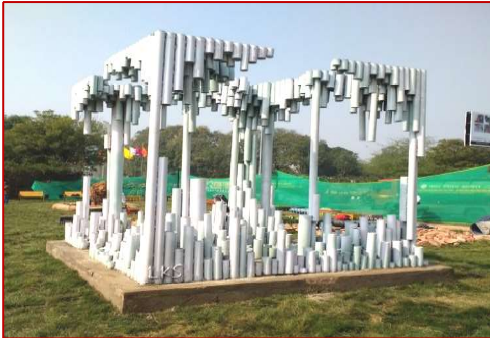
Melting ice 7 ft cube waste pipes Cost Worth Rs.8 Lacs