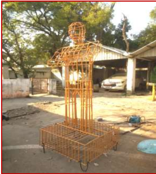
Welcome Man 10x4x4 ft., Mahak, Charul(BFA) Worth Rs. 3 Laes