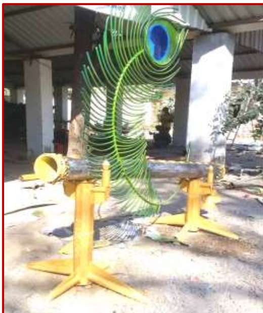
Flute 10x3x6 ft, Mohit Kasana(BFA) Worth Rs. 4 Lacs