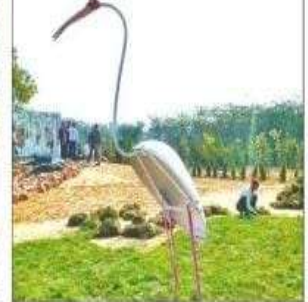
विधि के ललित कला संस्थान के सहयोग से नगर निगम की ओर से जी-20 के तहत आयोजित मूर्तिकला शिविर में छात्रों ने स्क्रैप मेटल से विभिन्न आकृतियां बनाईं। संजय