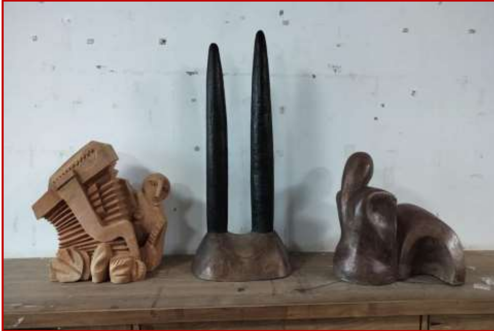
Terracotta sculpture at Art Gallery Sanskriti Bhawan Worth Rs. 1.5 Lacs