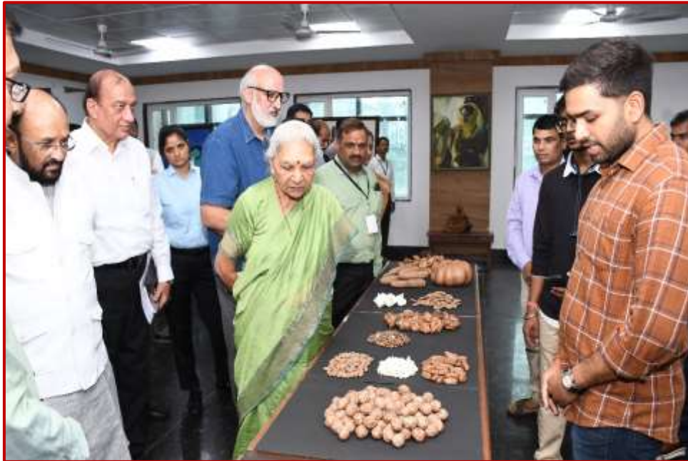
Students of Fine Arts explaining clay artifacts (Dry fruits) to Honorable chancellor during her visit to the university on September 2022