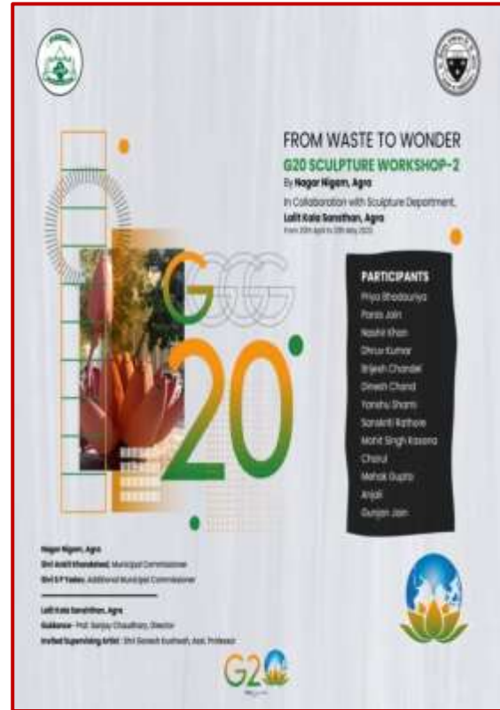
Poster for G20 scrap sculpture workshop