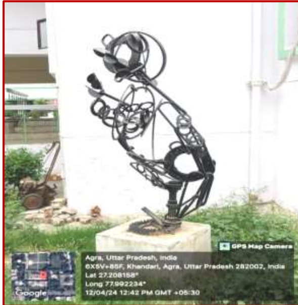
Abstract, Deepak Paunekar, Worth Rs. 3 Lacs