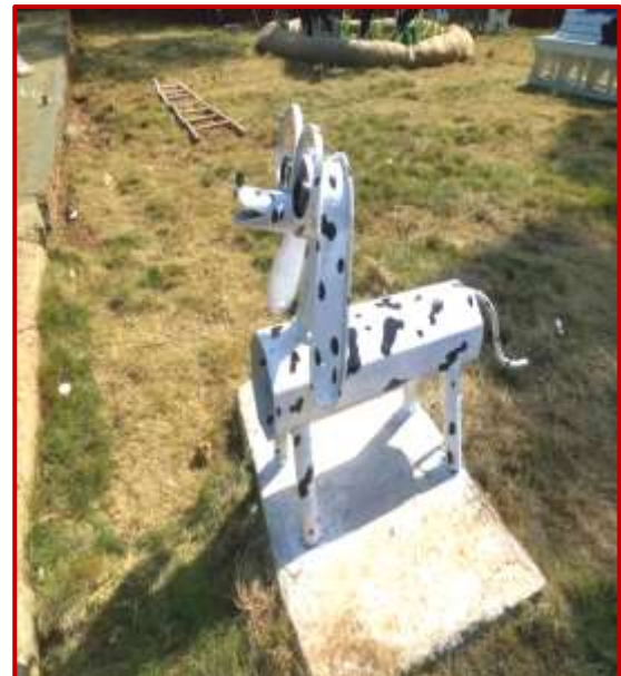
Dog 3x1x2 ft, Yanshu and Prachi (BFA) Worth Rs. 80k