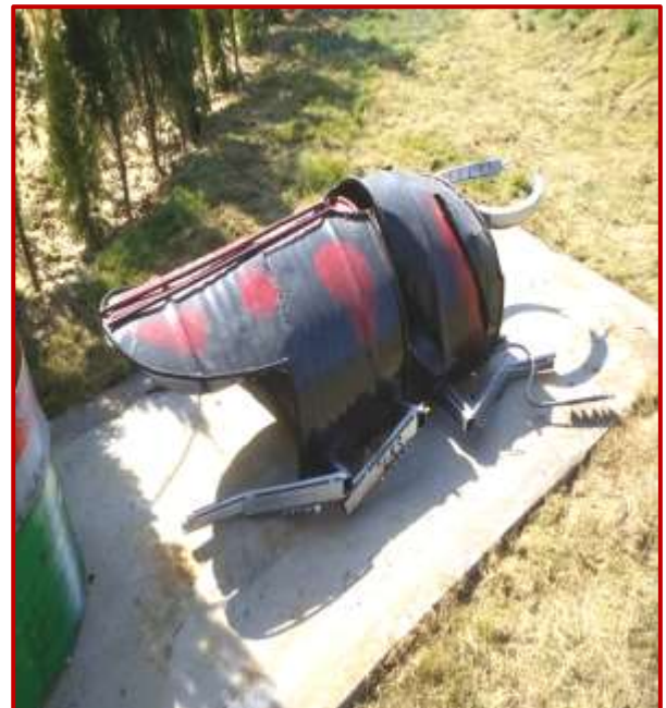
Betel by Sanskrit(BFA) and Prachi(BFA) Worth Rs. 1 Lac