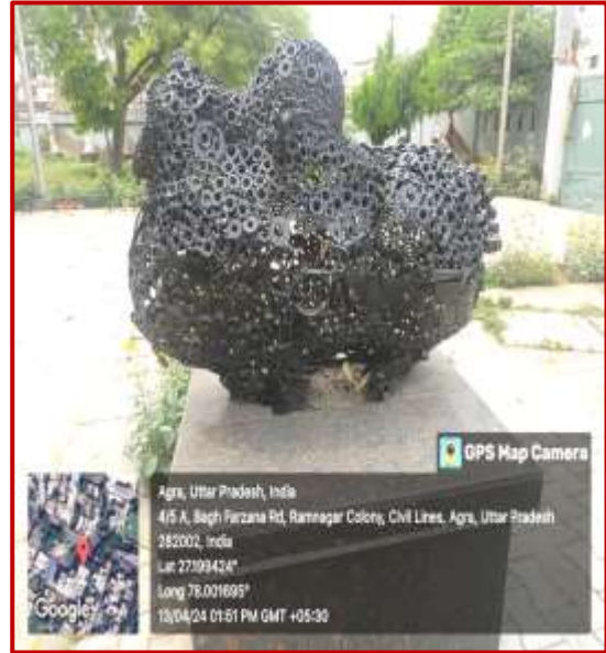
Nandi, Uttam Prachrne Worth Rs. 5 Lacs