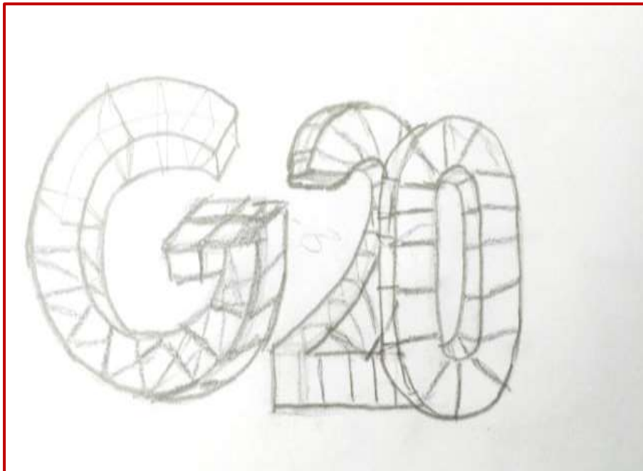
Sanskriti, a student of BFA making drawing layout for sculpture