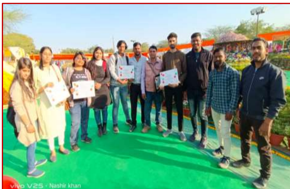
Students and Faculty with G20 scrap sculpture certificates