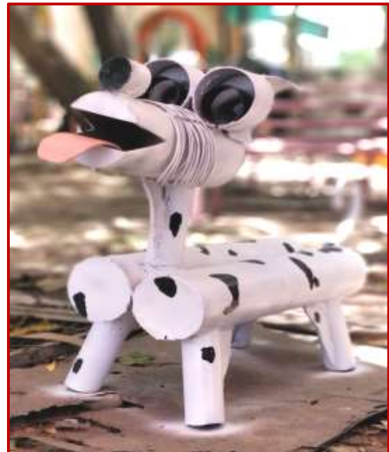
Dog 3.3x2.4x1ft., Yanshu and Prachi(BFA) Worth Rs. 90k