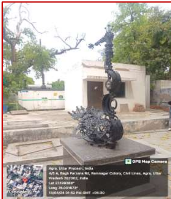
Floating Bird, Vikrant Manjrekar Worth Rs. 4 Lacs