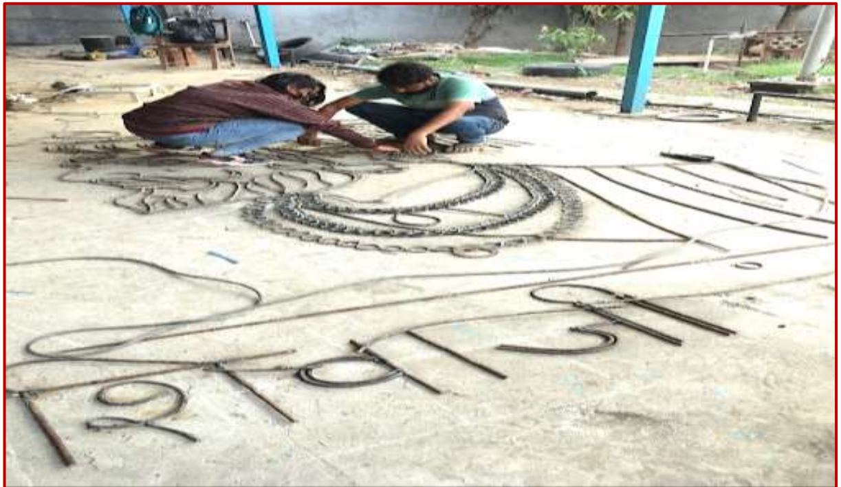
Sanskriti, a student of BFA making drawing layout for Shivaji wall sculpture for Shivaji Mandapam of the University