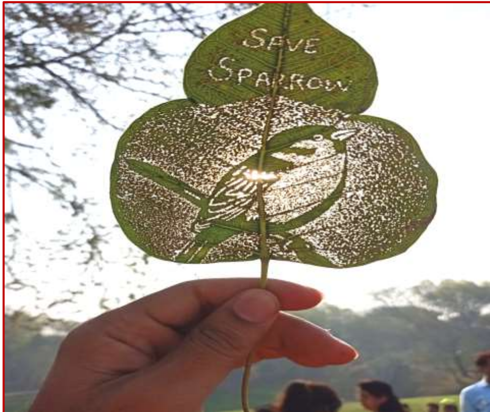
Leaf painting through nailing by students on World Sparrow Day