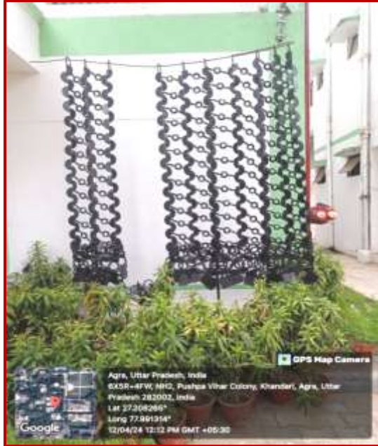
Curtain, Pradeep Kamble, Worth Rs. 5 Lacs