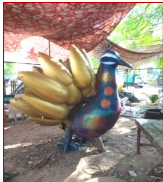
Peacock 8x6x5 ft, Paras Jain(MFA) Worth Rs. 5 Lacs