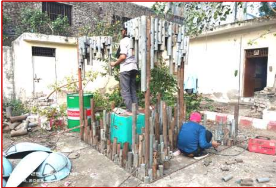
Work in progress on Melting Ice Cube