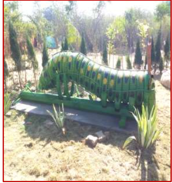
Caterpillar made of tyres and iron scrap by Paras Jain (MFA) Worth Rs. 7 Lac