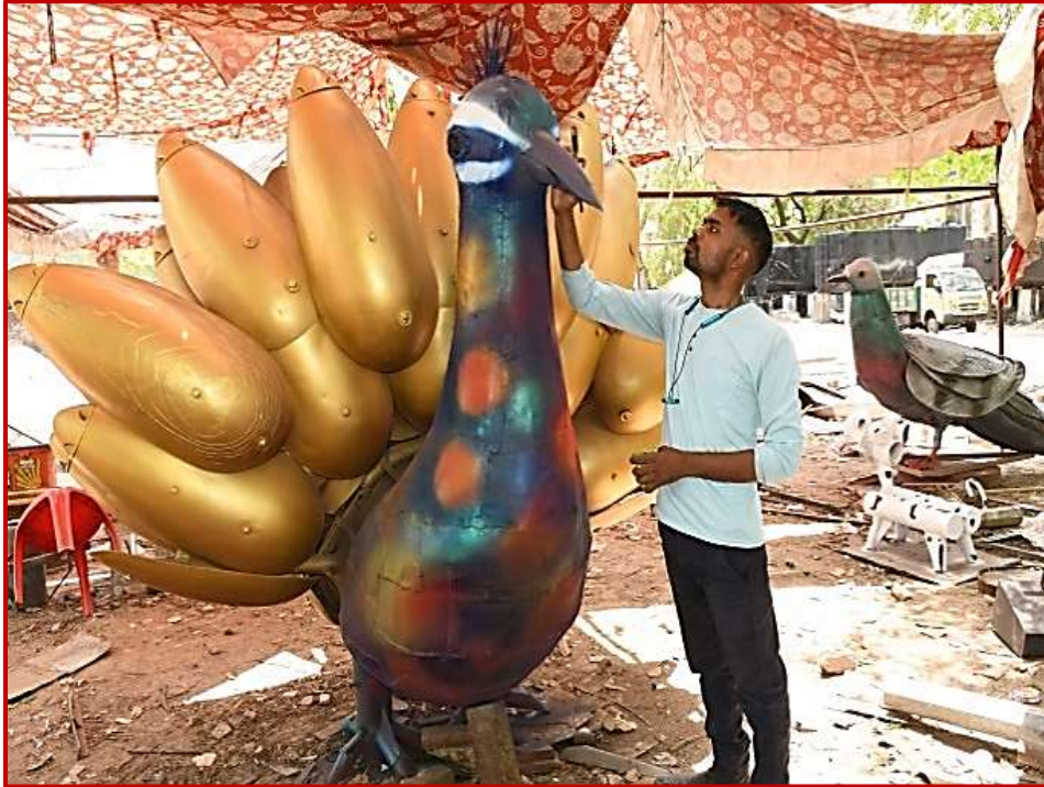
Paras, MFA, painting on peacock