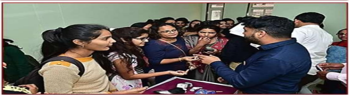
Health Checkup for University Females