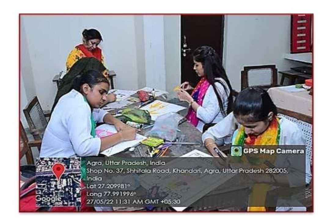
Poster Making Competition on "Gender Equity"