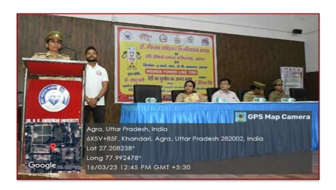
Seminar on "Women Power Line 1090"