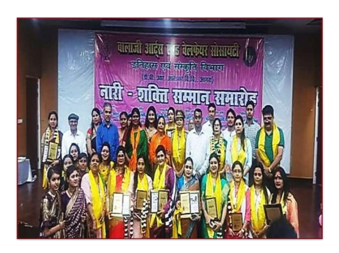
Naari Shakti Samman