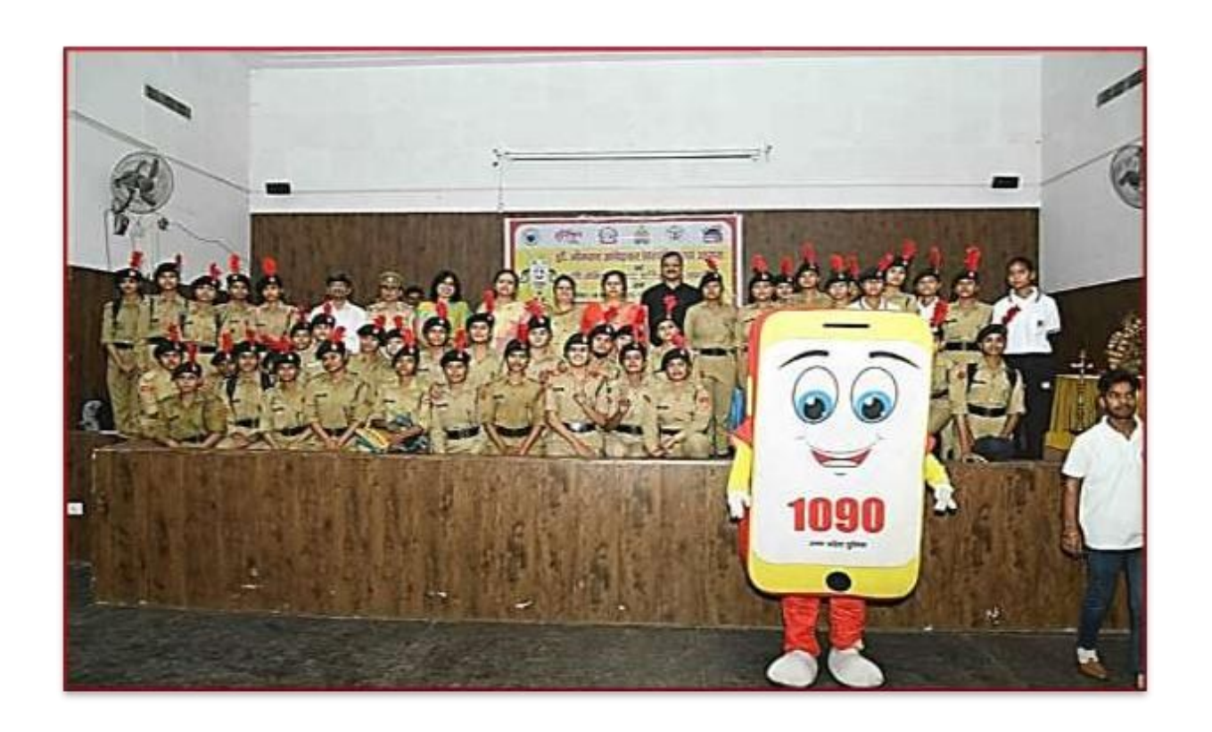
Seminar on 'Women Power Line 1090' in association with 'Anti Romio Squad