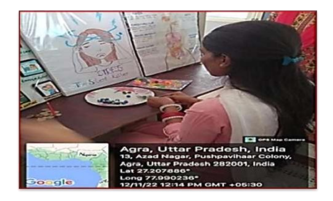
Program on "Stress Evaluation and Management"