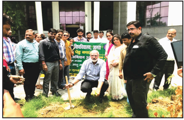
Ped Lagao Ped Bachao Vraksharopan Mahaabhiyan 2024

विश्वविद्यालय के दौ दयाल संस्थान में युवा संसद का आयोजन किया गया ।छात्रों ने विभिन्न मुद्दों पर चर्चा करते हुए करते हुए शिक्षा और रोजगार पर विशेष रूप से बल दिया ।