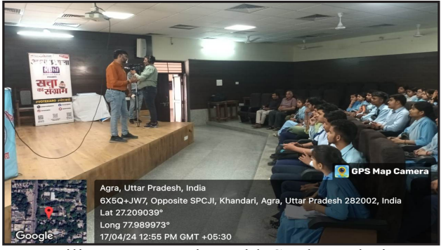
Facilitator Interacting with Students during the Program

An awareness program "Satta ka Sangram" was organized in association with Amar Ujjala on 17th April 2024 SPCJIM. 30 students have shared their views or expectations from Lok sabha Elections. Aim of the program was to create awareness among youth for their voting rights under slogan "Vote Karo".