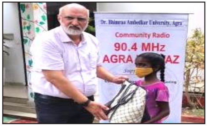
पोषण पोटली वितरण – मई से जून 2024