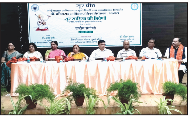
संगोष्ठी उद्घाटन सत्र