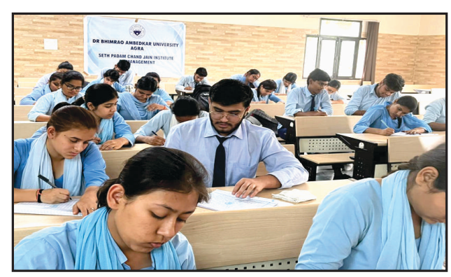
Students participating in Quiz Competition at SPCJIM