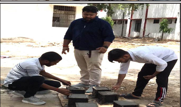
Concrete Casting By Students of IET